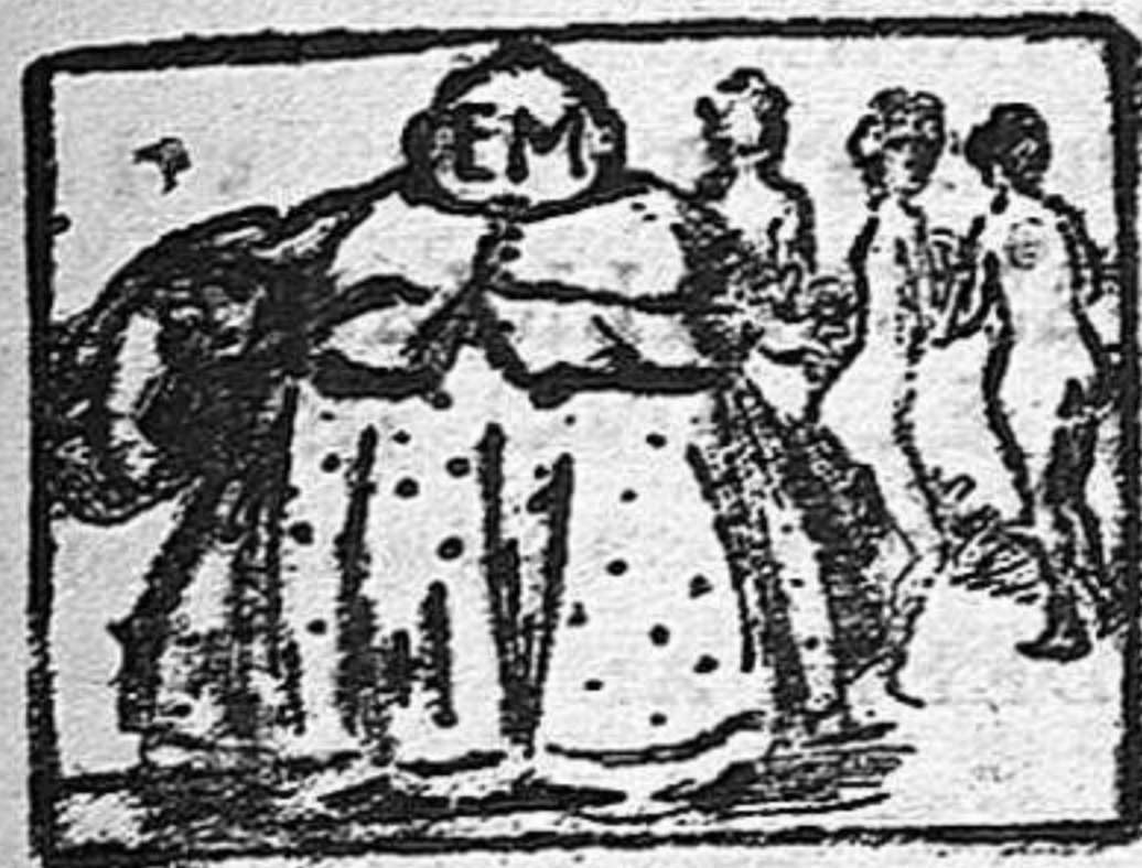
(La solución en el número próximo).

Solución a la Charada en acción Engallado.