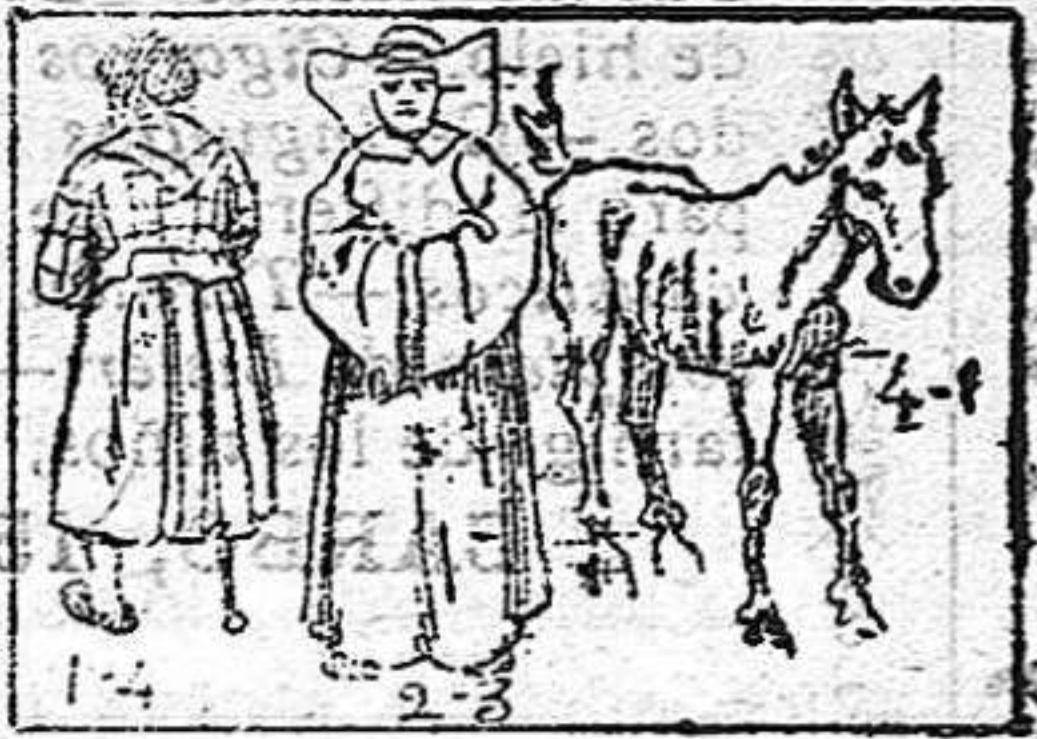
(La solución en el número próximo).

Solución al Jeroglífico anterior: A trompada limpia.