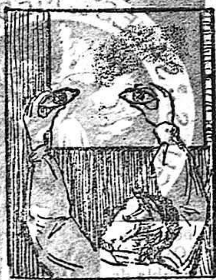
(La solución en el número próximo).

Solución a la Charada en acción: Imaginativas.