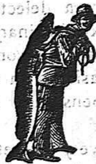
Obténase siempre la Emulsión con esta marca "El Pescador" marca del procedimiento SCOTT

La Emulsión SCOTT es la única emulsión con poder para curar los casos agudos de anemia, cual la del Sr. Portell y ello es debido en primer lugar á que los ingredientes que la componen son escogidos siempre entre los mas puros y refinados y luego porque con la elaboración por el procedimiento SCOTT único en su clase se asegura la fácil digestibilidad. La Emulsión que ha curado repetidas veces