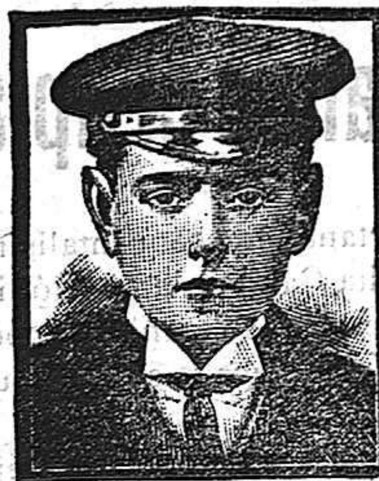
Barcelona, 11 Abril 1908. (Calle Conde Asalto nº 42.)

Templo Expiatorio.—Los mismos cultos que ayer.