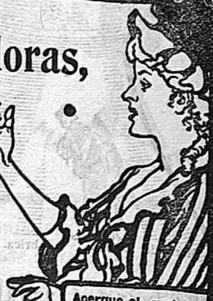
Acertue el grabado a los ojos y verá Vd. la píldora entrar en la boca.

DE VENTA EN LAS BOTICAS DEL MUNDO ENTERO.