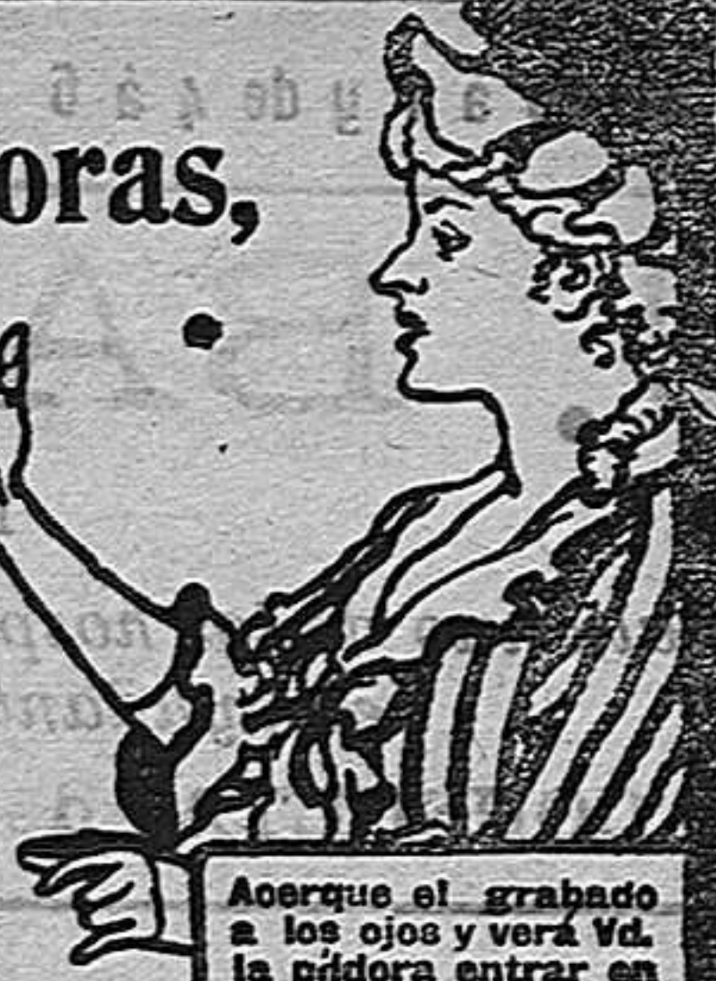
Acerque el grabado a los ojos y verá Vd. la píldora entrar en la boca.

DE VENTA EN LAS BOTICAS DEL MUNDO ENTERO.