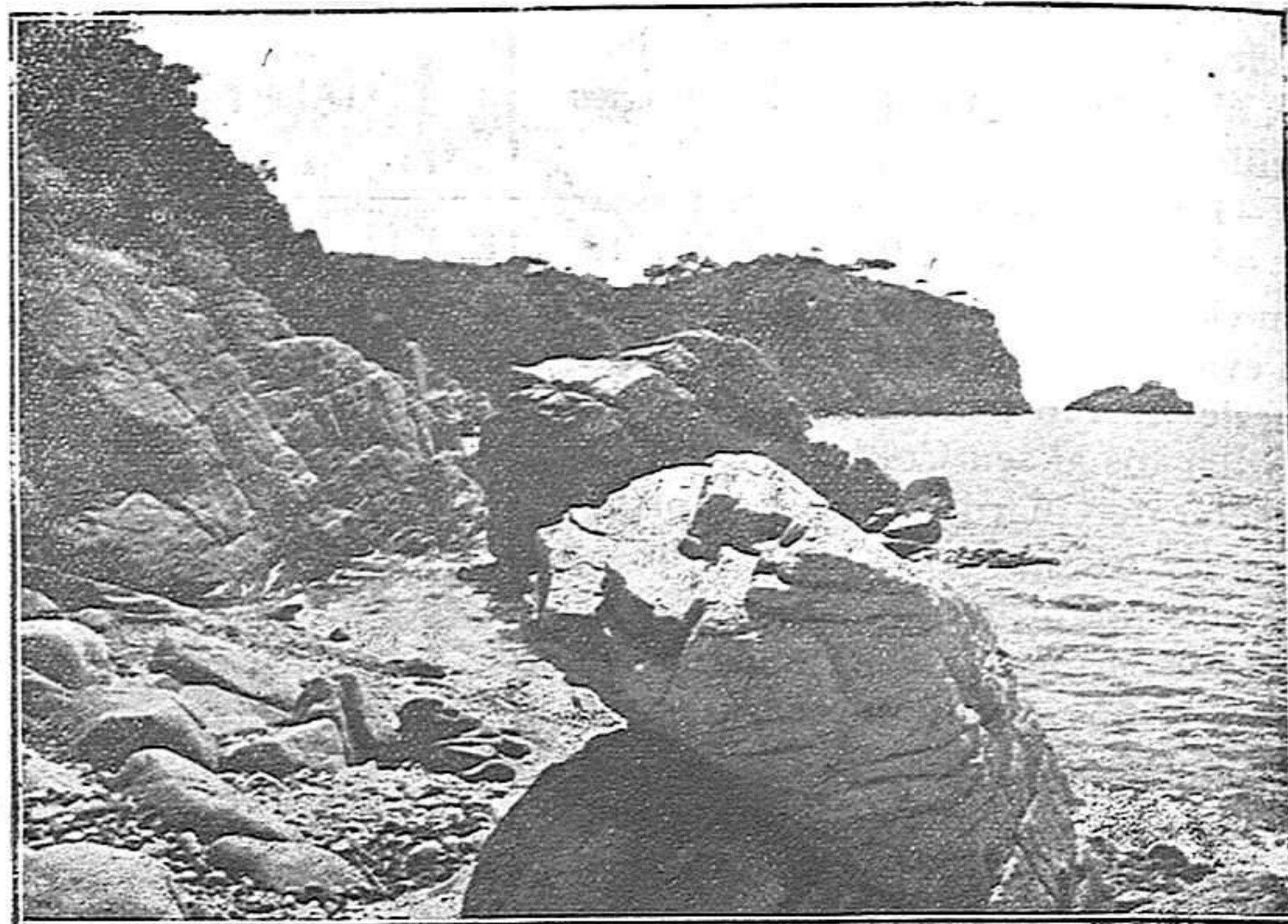
Guixols - Sota Sant Elm