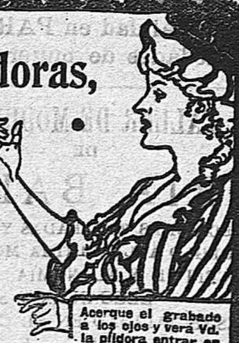
Acórrese el grabado a los ojos y verá Vd. la píldora entrar en la boca.

Las Píldoras de BRANDRETH, purifican la sangre, activan la digestión, y limpian el estómago y los intestinos. Estimulan el hígado y arrojan del sistema la bilis y demás secreciones viciadas. Es una medicina que regula, purifica y fortalece el sistema.