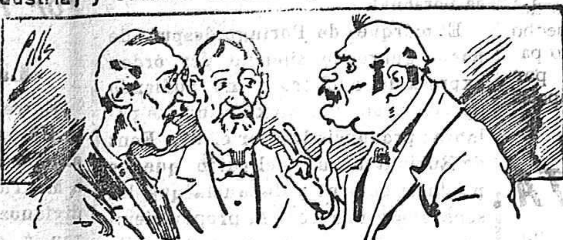
Abominan a nuestros libros..... pero los compran.

fórmulas para toda clase de industria, y cuantas noticias y conocimientos puedan ser beneficiosos. Cuenta además con buenos grabados, parte literaria excelente; da regalos mensuales a sus lectores con la Lotería Nacional y participaciones en la misma, a cuyo efecto compra todos los sorteos, y en una de las Administraciones más afortunadas por la suerte, billetes enteros. La suscripción y los números que se nos pidan se sirven gratuitamente a correo vuelto y franqueados, con sólo indicar el nombre y dirección del que lo desea en sobre dirigido al Sr. Administrador de