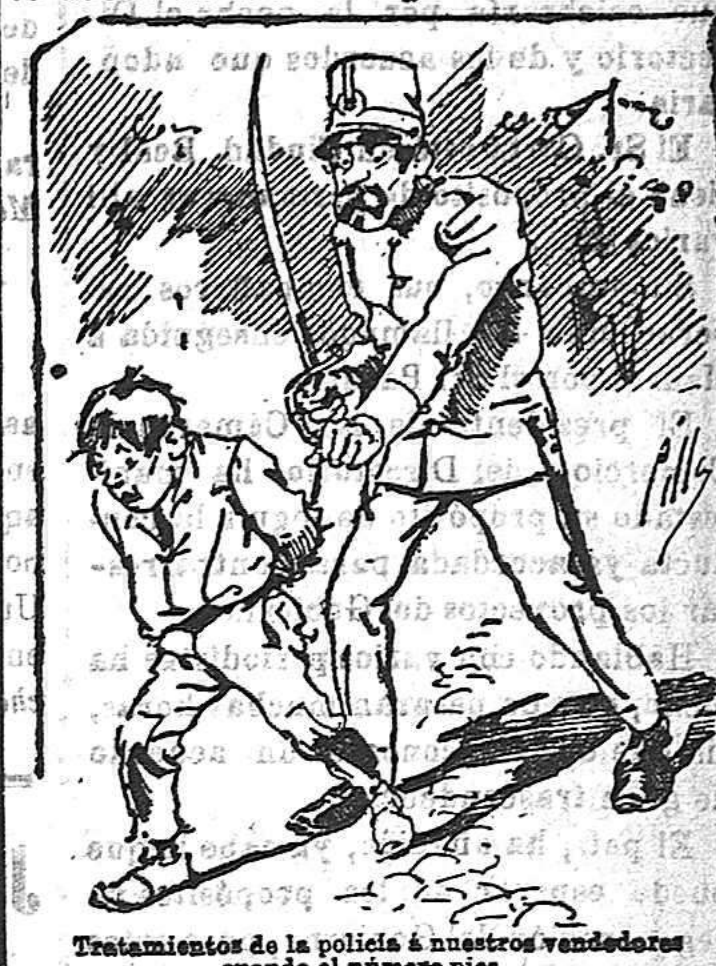
Tratamiento de la policía a nuestros vendedores cuando el número pica.....