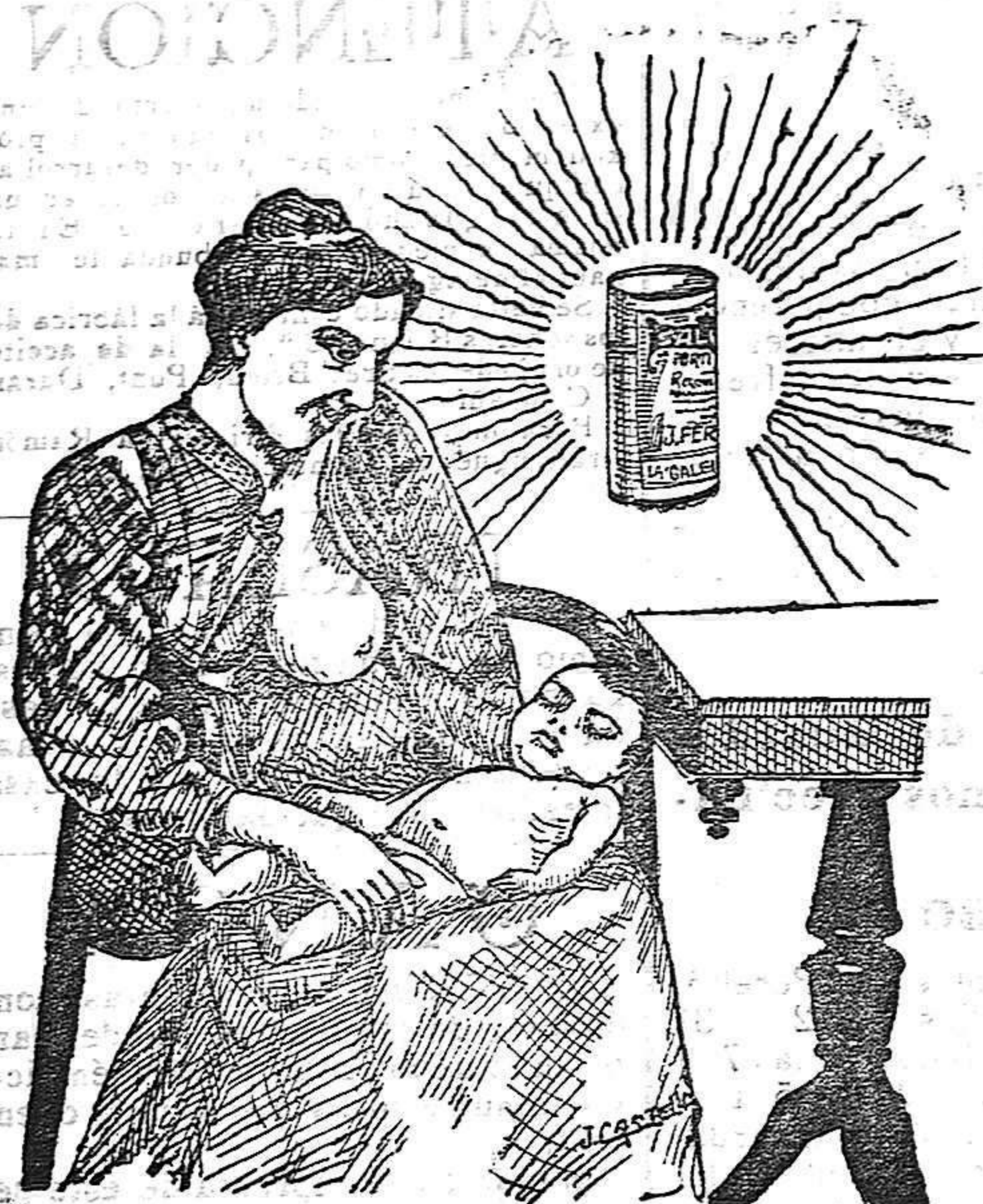
La que hizo caso del Salverol

Depósito general S. A. del Salverol en Santa Bárbara (Tarragona)