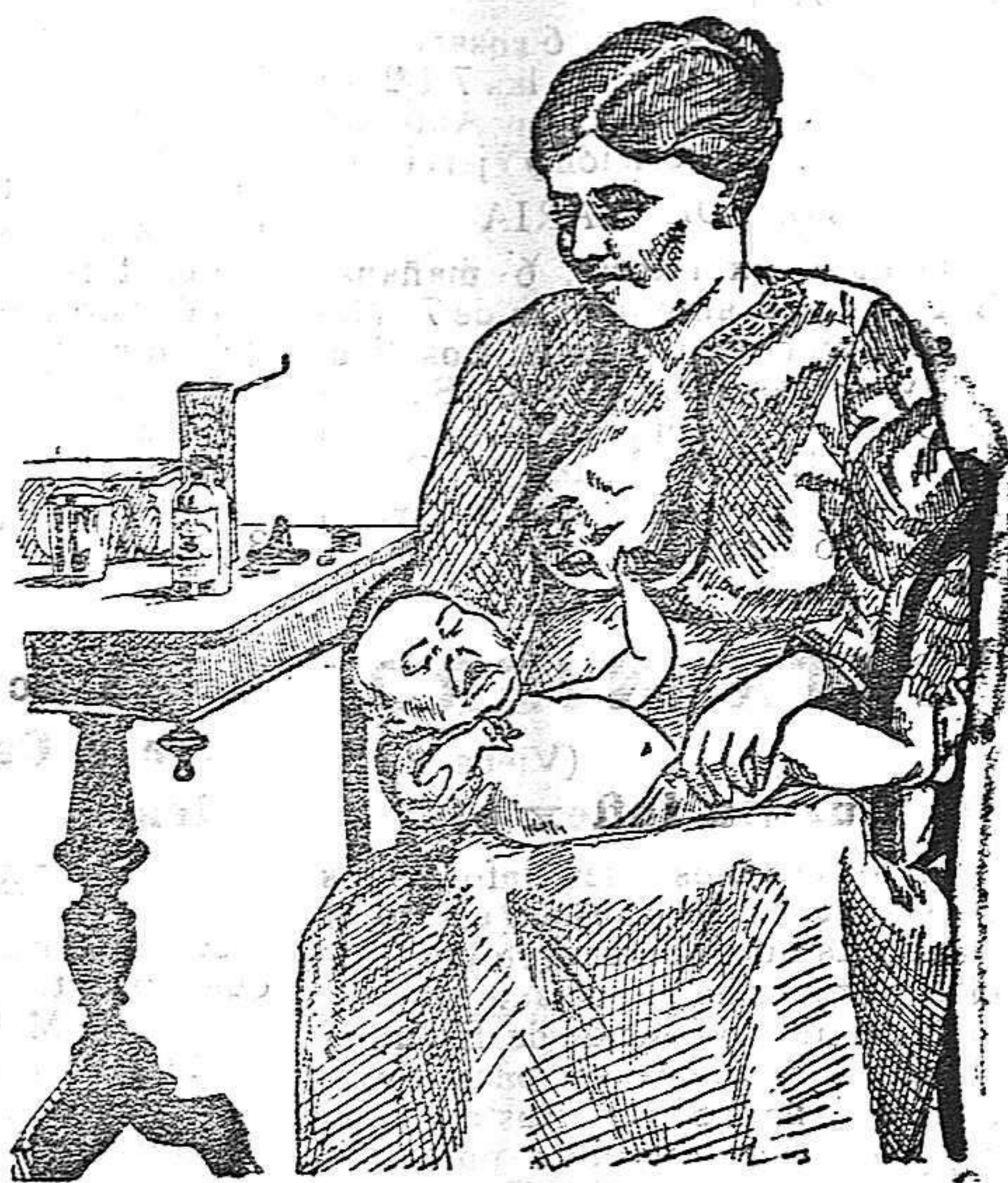
La que no hizo caso del Salverol