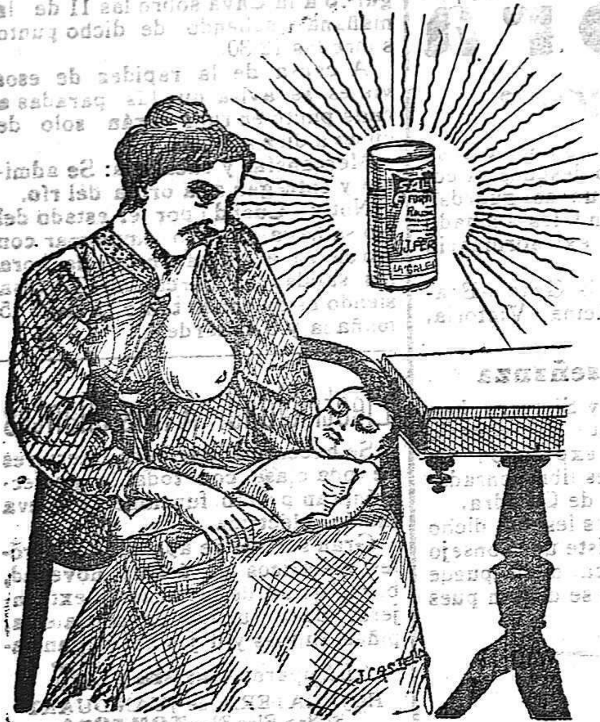
La que hizo caso del Salverol

Depósito general S. A. del Salverol en Santa Bárbara (Tarragona)