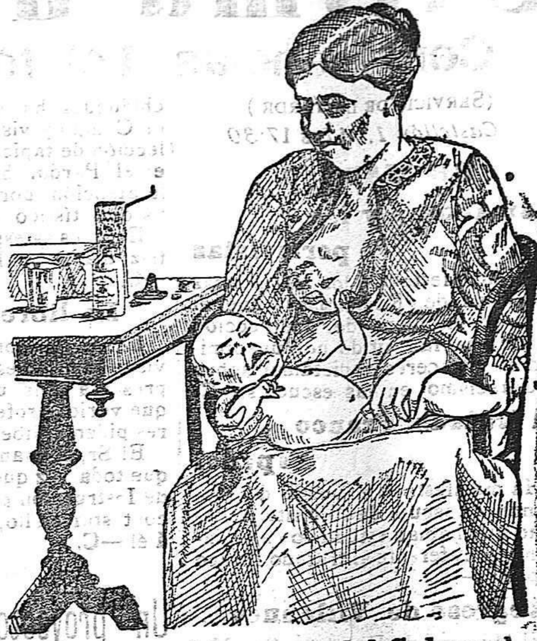
La que no hizo caso del Salverol