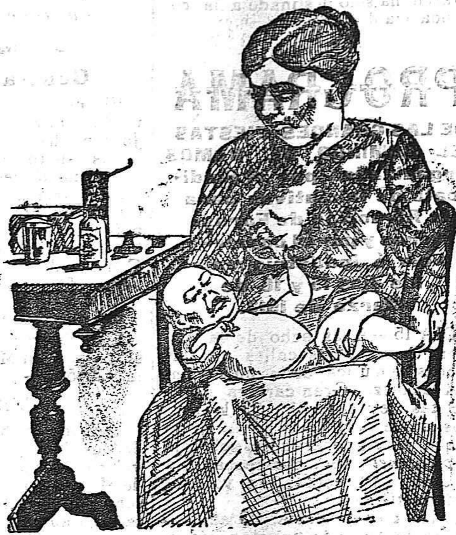
La que no hizo caso del Salverol