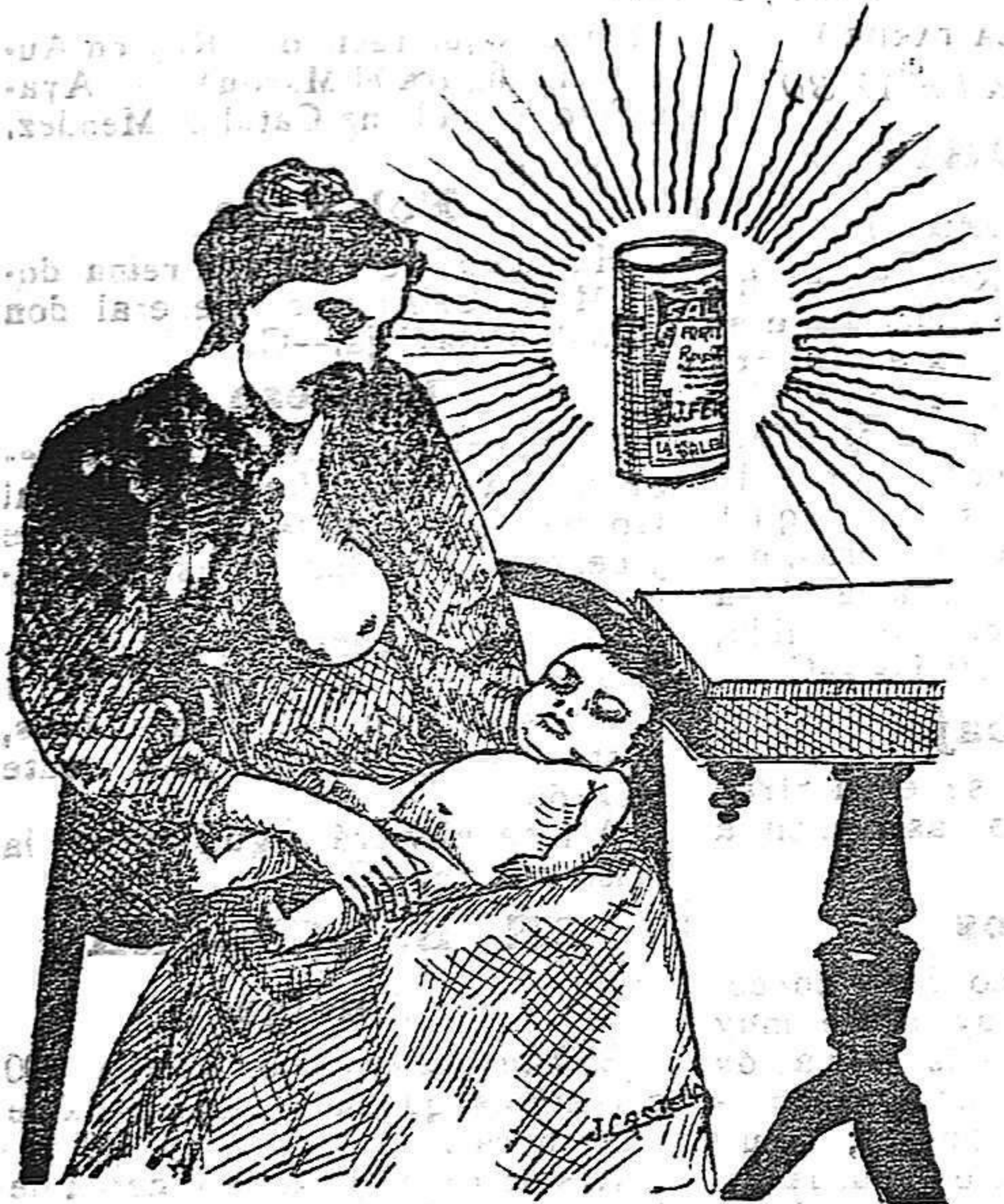
La que hizo caso del Salverol

Depósito general S. A. del Salverol en Santa Bárbara (Tarragona)