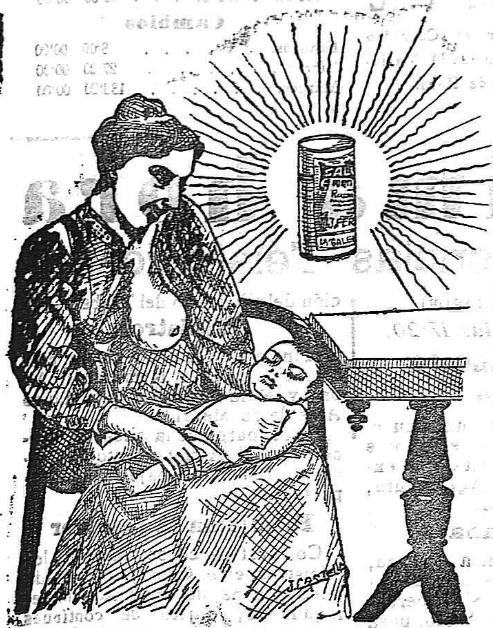
La que hizo caso del Salverol

Depósito general S. A. del Salverol en Santa Bárbara (Tarragona)