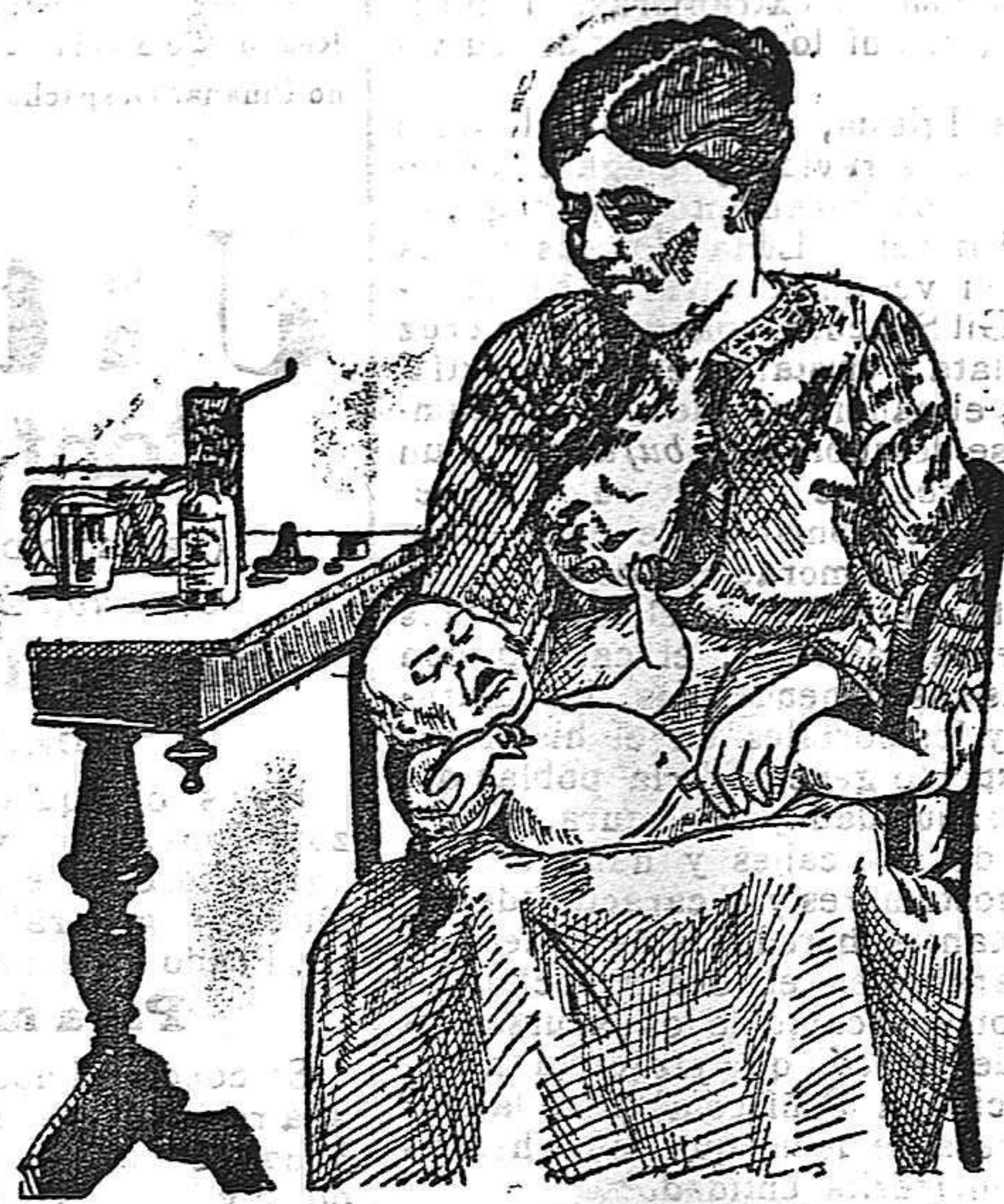
La que no hizo caso del Salverol

Indispensable superioridad CHOCOLATES CAFES MOLIDOS Y EN GRANO TES, TAPIOCAS