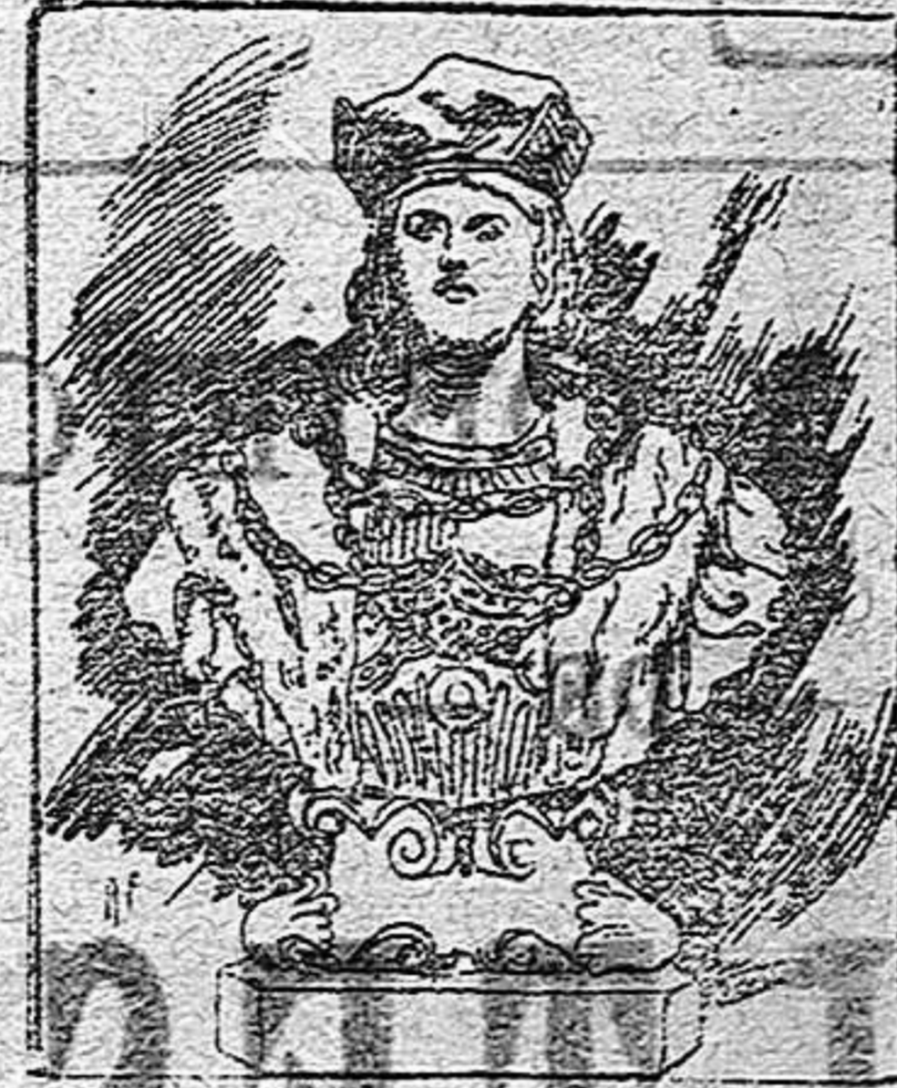
Busto de D. Gonzalo de Córdoba LLAMADO EL GRAN CAPITAN

En los círculos se han comentado estas declaraciones del jefe del Gobierno y muchos políticos que discutían las palabras del señor Sagasta terminaban la polémica con la frase célebre de Martos: «¡Dios sobre todo!»