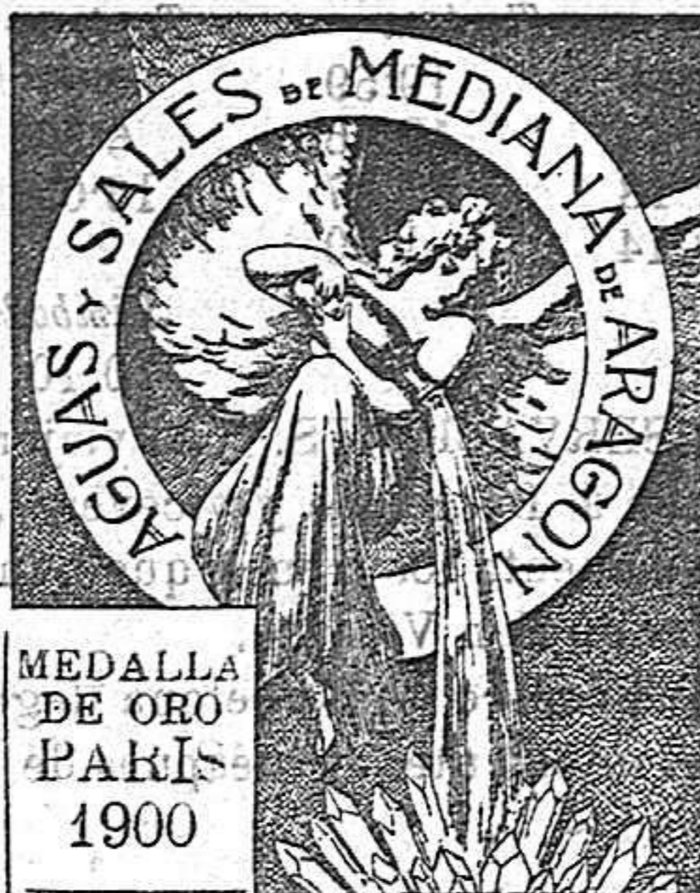
MEDALLA DE ORO PARÍS 1900

Tomadas en Loción y Baño son eficacísimas y superiores á todo tratamiento para combatir el Herpetismo, Escarfulismo, Eczemas, y todas las afecciones de la piel que tienen por origen la impureza de la sangre.