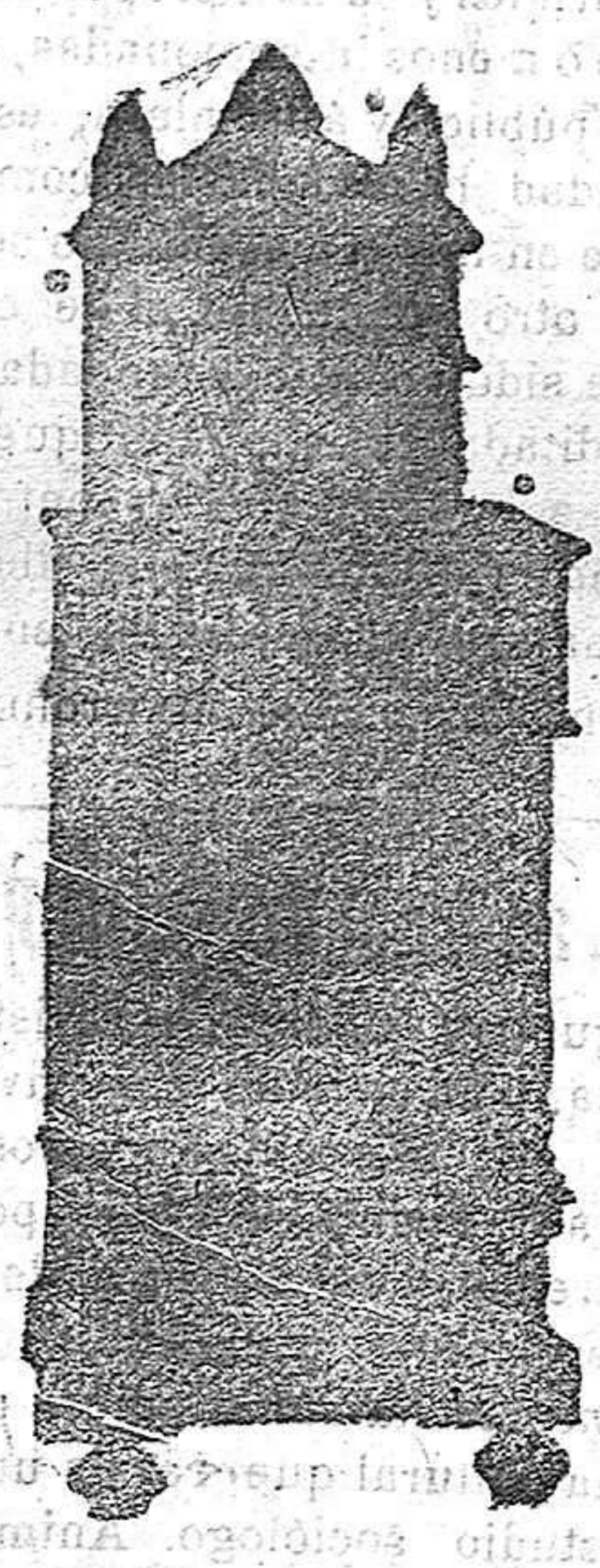
Moncada, y Carmen 2 y 3

Única casa para el arreglo de salones. FONOGRAFOS ODEON e una sonoridad y armonía perfectas, desde 50 a 40e pesetas, a plazos y al contado. Discos de dos caras. SOLIDEZ, ELEGANCIA, ECONOMIA (Moncada, 16 y Carmen, 2 y 3) TORTOSA