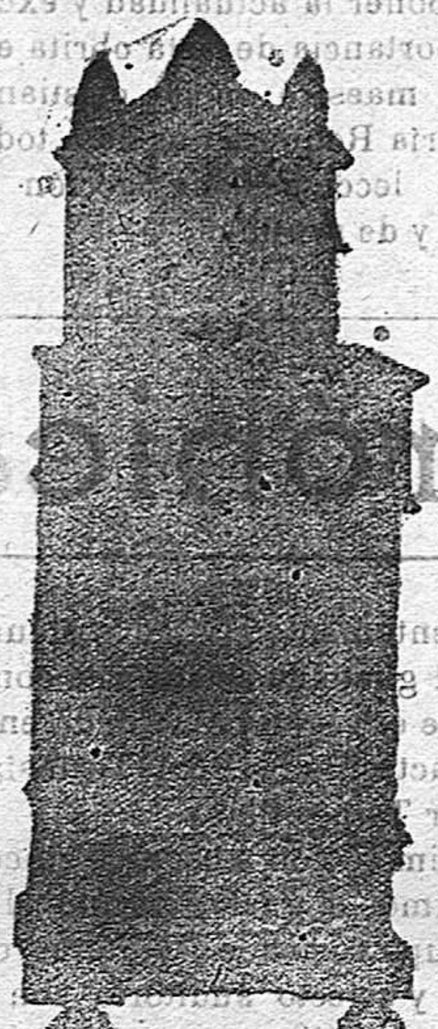
Moncada, 6 y Carmen 2 y 3

Manuel Panisello Depósito de muebles de todas clases y gran surtido en los de viena Única casa que se dedica al arreglo y decoración de salones. Especialidad en muebles de encarga. Almacenes de Blauquet y Anea. MÁQUINAS PARLANTES y discos doble cara ODEÓN Instrumentos de música de todas clases. Se venden y alquilan Pianos y armoniums. Se arreglan toda clase de Gramophones. Pidanse catálogos de aparatos y discos que se remitirán gratis. (Moncada, 16 y Carmen, 2 y 3) TORTOSA