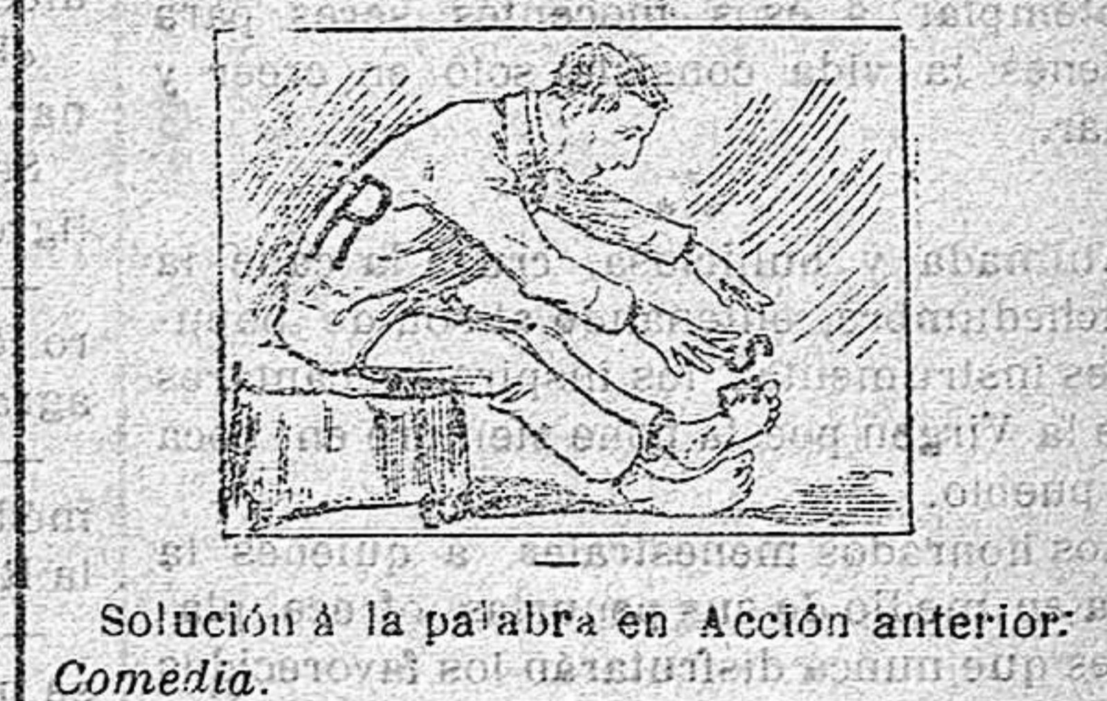
Solución á la palabra en Acción anterior: Comedia.