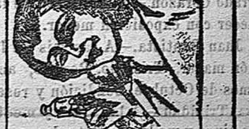
Farmacia del autor, Plaza del Píno, 6 BARCELONA y principales de América

El Morrhuol contiene todos los principios primitivos del aceite de hígado de bacalao, obra más rápidamente que el aceite de hígado de bacalao, en los hospitales, por acrecitudo de los médicos, en Chile ha demostrado que el Morrhuol es mucho más eficaz que el aceite de hígado de bacalao. De la unión del Morrhuol con los hipofosfatos y la caseína resulta el mejor medicamento que se ha conocido, es el agente más eficaz para combatir la bronquitis, el asma, la tisis, la escrófula, la anemia y el raquitismo. No contiene el Morrhuol ningún elemento que pueda ejercer un efecto nocivo en el organismo. De venta en todas las farmacias y principales de América.