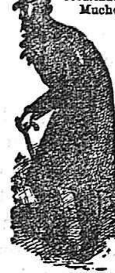
El que no usa el REPAIRER Wosmahe.

Paros que el Creador ha dispuesto que antes que la sangre, sea el fluido vital la sustancia que se consume y que curan más pronto y radicalmente todas las ENFERMEDADES URINARIAS. Premiado con medallas de oro en la Exposición de Barcelona, 1888 y Gran Concurso de oros, 1895. Veintitantos años de éxito creciente. Única aprobada por las Reales Academias de Barcelona y Mallorca; y por corporaciones científicas y renombrados prácticos diariamente practican, reconociendo ventajas sobre todos sus similares.—Frasco 10 reales.—Farmacia del Dr. Pizá. Plaza del Pino, 6, Barcelona, y principales de España y América. Se remiten por correo anticipando su valor.