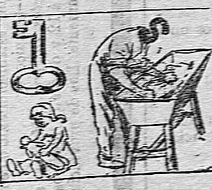
Solución a la adivinanza anterior: Sinforosa.