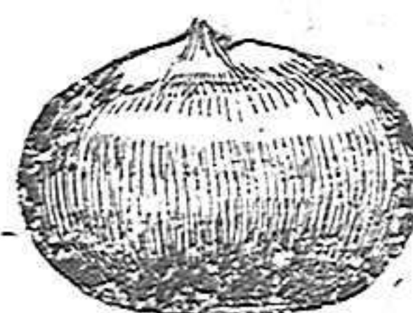
CASTAÑAS DEL JAPÓN

Comprobada la resistencia de la Castanea Creuata (C. del Japón), a la enfermedad de la tinta, único medio de conservar los castañares, ofrecemos arbolillos ya arraigados en disposición de plantarse inmediatamente.