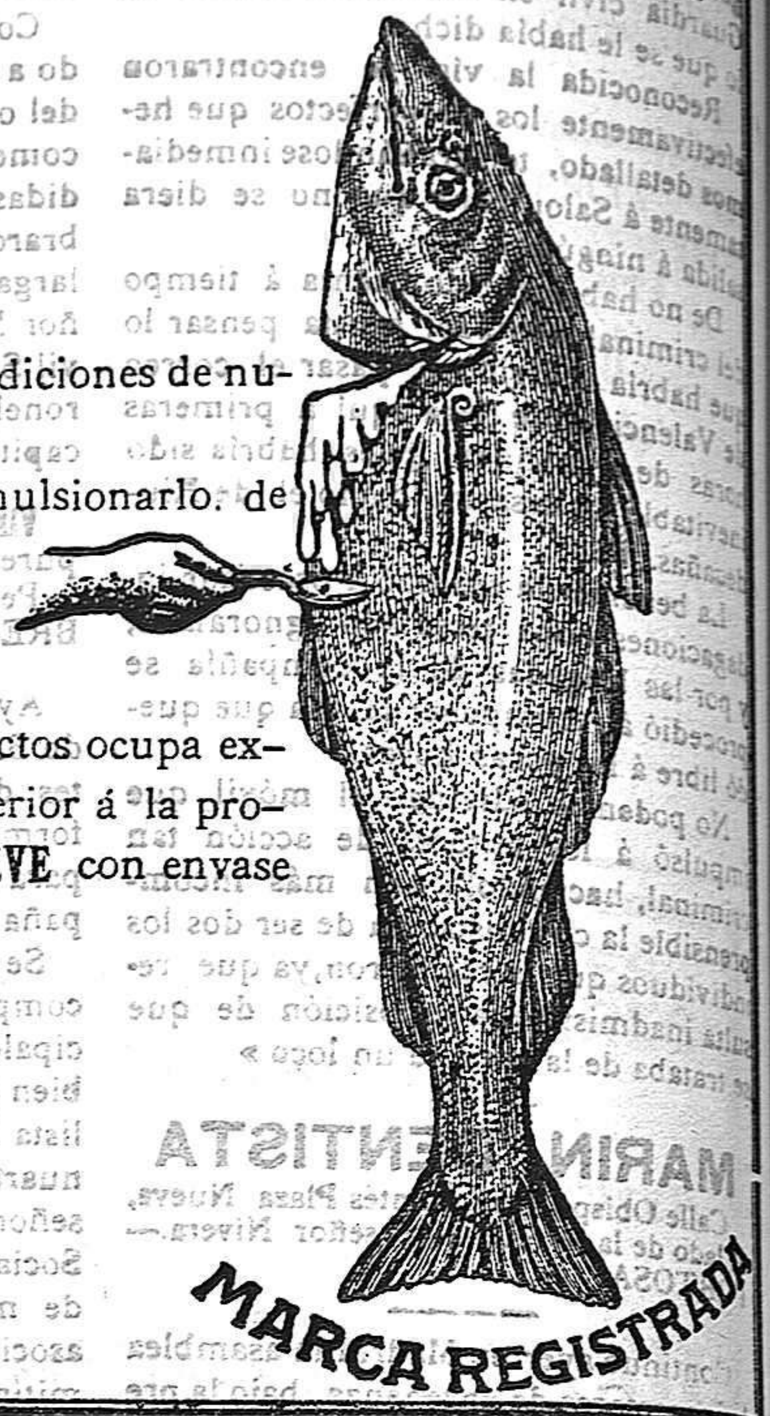
MARIN ENLISTA MARCA REGISTRADA

El más abundante en principios activos, pues los bacalao de donde se extrae son seleccionados entre los que ofrecen mejores condiciones de nutrición. Superior a todas las emulsiones, pues éstas sólo contienen escasa cantidad de aceite siendo el resto sustancias necesarias para emulsionarlo: de acción completamente inútil cuando no perjudicial. Siendo el ACEITE GEVE obtenido por presión suave, está exento de residuos orgánicos a los que deben las clases comerciales su gusto y olor repugnante. El aceite de hígado de bacalao es uno de los más preciosos agentes con que cuenta la medicina, y la relación de sus magníficos efectos ocupa extensas páginas en los tratados de terapéutica. Pero debéis desconfiar del que se presenta en el comercio, pues siendo el consumo superior a la producción, la mayoría es falsificado. Si queréis estar seguros de una pura absoluta y perfecta elaboración, debéis exigir la marca GEVE con envase original, ya que está garantizado por el análisis de eminentes químicos, cuyos certificados acompañan los frascos.