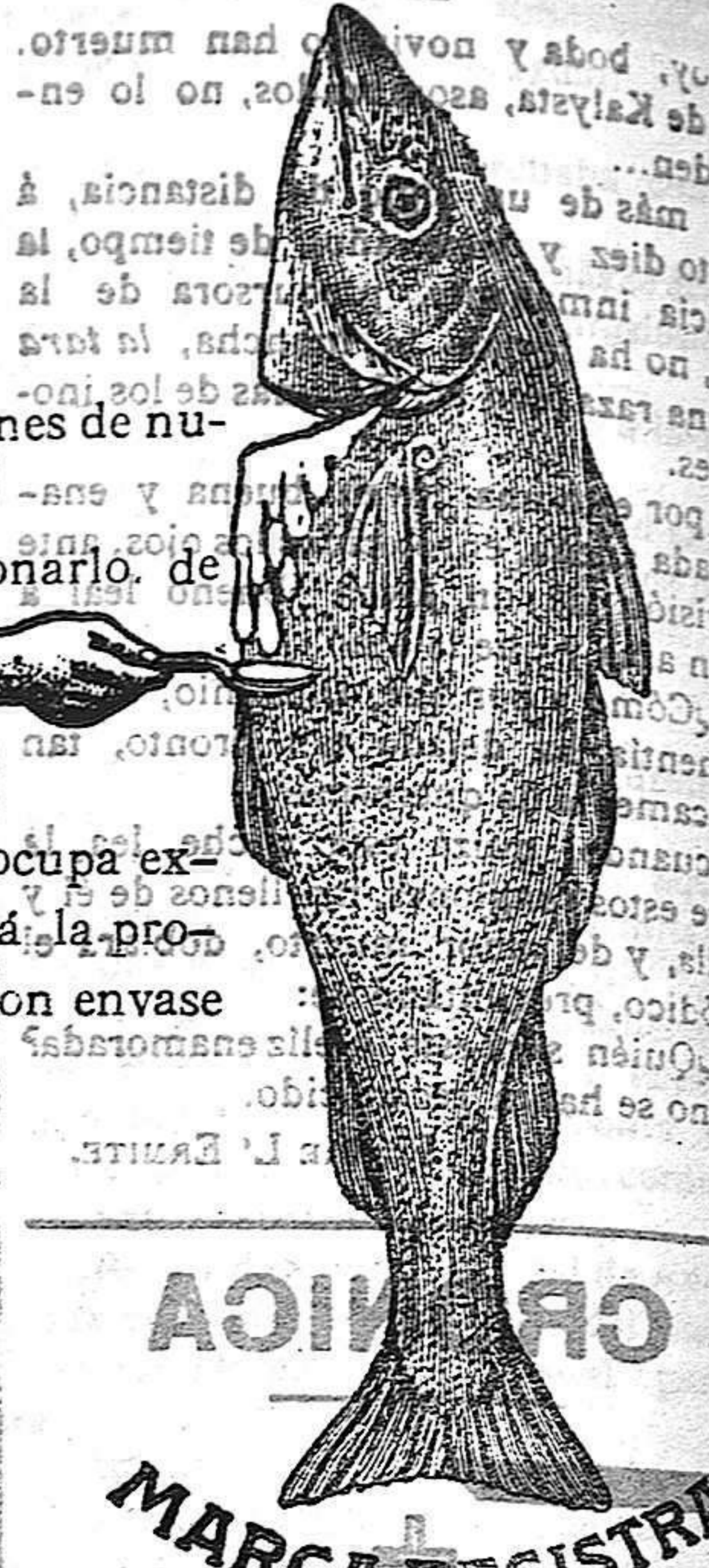
GRANICA MARCA REGISTRADA

El aceite de hígado de bacalao es uno de los más preciosos agentes con que cuenta la medicina, y la relación de sus magníficos efectos ocupa extensas páginas en los tratados de terapéutica. Pero debéis desconfiar del que se presenta en el comercio, pues siendo el consumo superior a la producción, la mayoría es falsificado. Si queréis estar seguros de una pureza absoluta y perfecta elaboración, debéis exigir la marca GEVE con envase original, ya que está garantizado por el análisis de eminentes químicos, cuyos certificados acompañan los frascos.