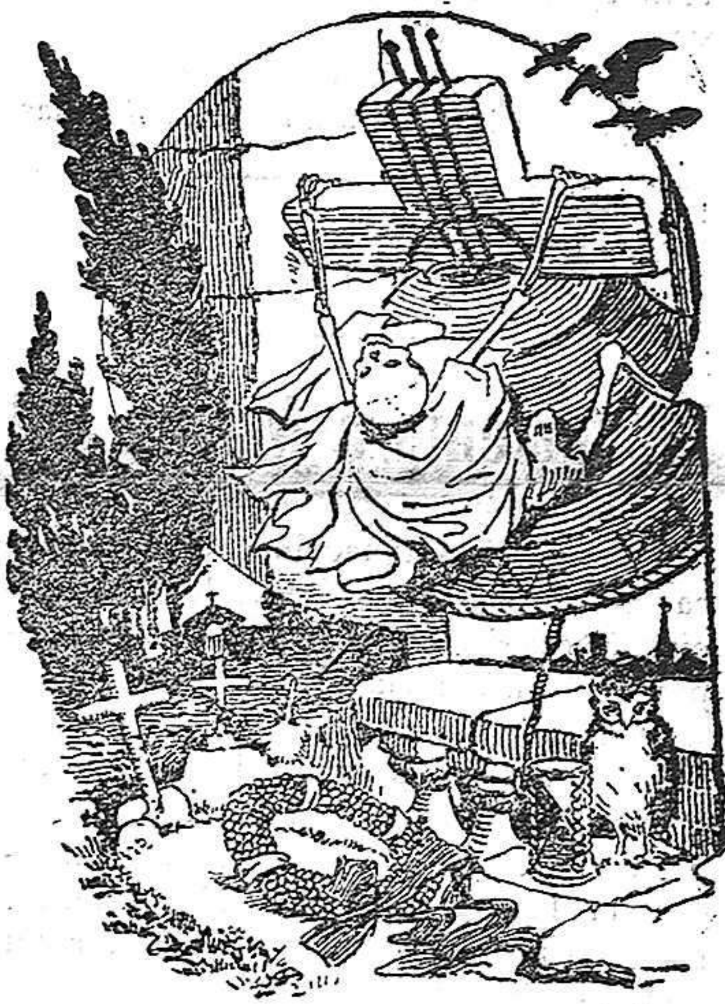
Alegoría de la Conmemoración de los fieles difuntos

El impío más empedernido no deja de sentir conmovida su alma, al eco re-