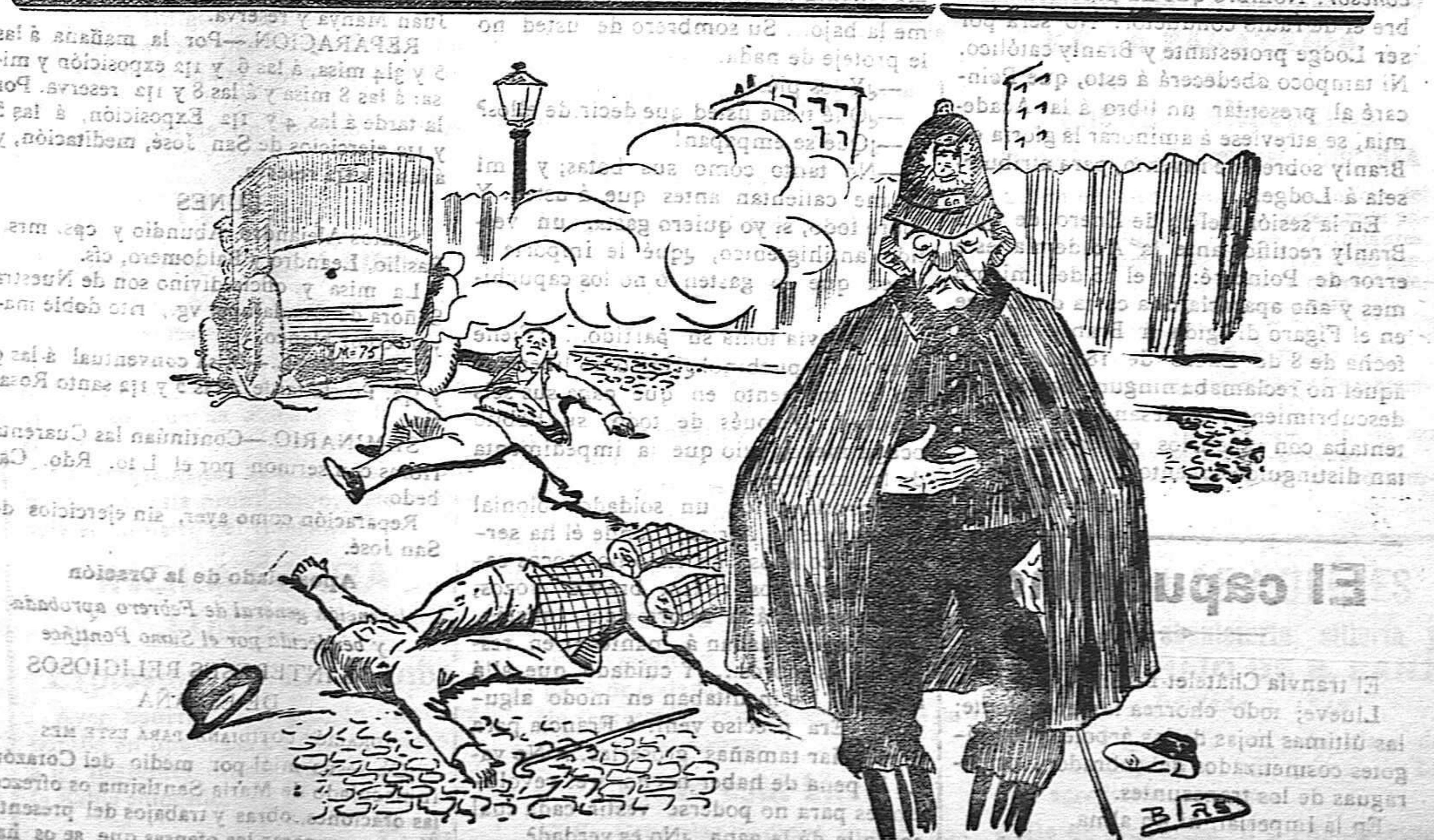
Gracias a estos nuevos aparatos facilitados a la policía, si no se consigue evitar los atropellos, al menos se puede saber «a que velocidad» atropellan los autos... ¡qué ya es un consuelo!