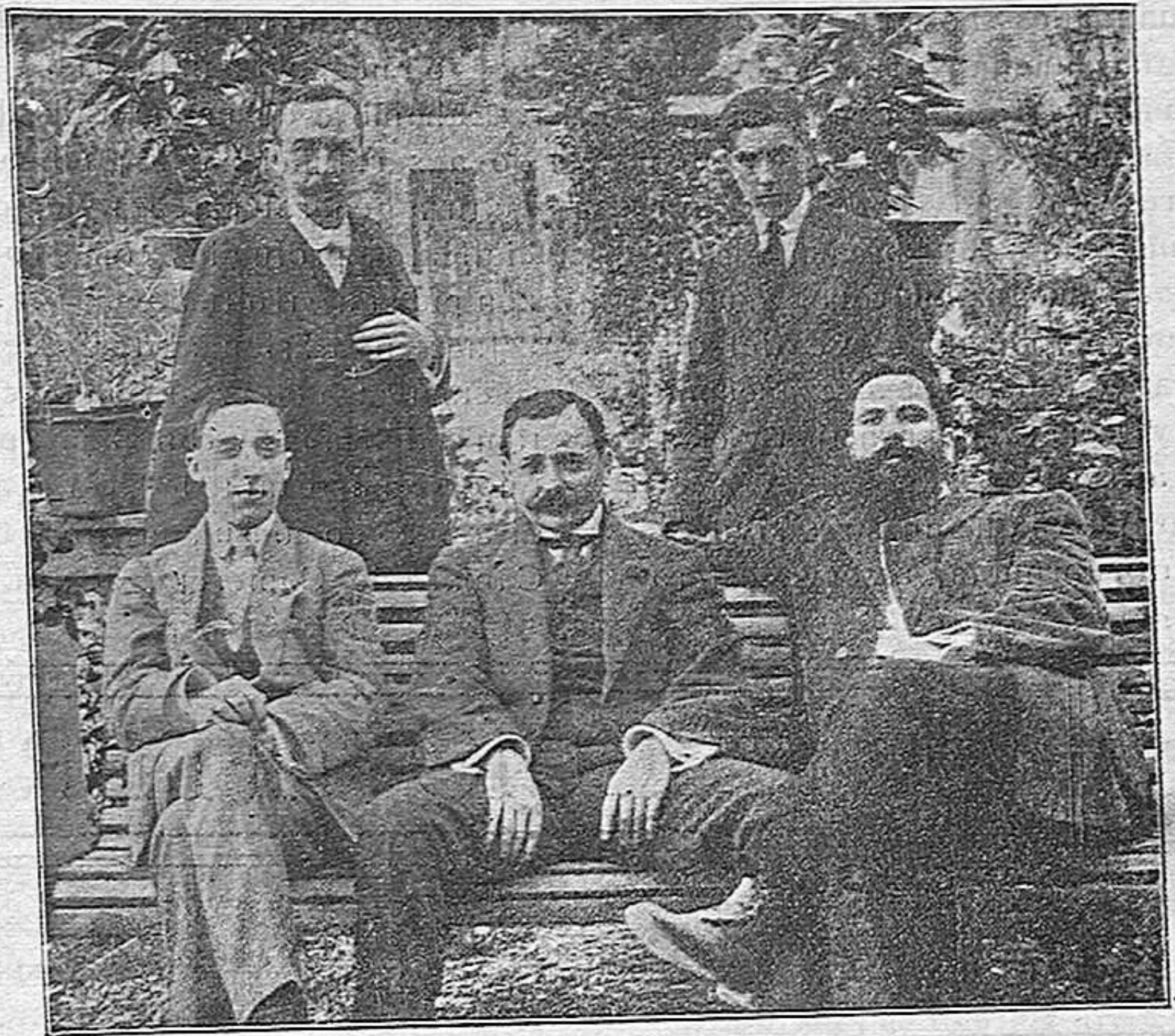
QUINTET DE L'«ACADEMIA MUSICAL GERUNDENSE» A QUINA ENTITAT S'HA CONFIAIT UN CONCERT EN LES FESTES D'INAUGURACIÓ DE LA SOCIETAT CULTURAL «ATHENEA»

Nuestro comercio interior exige igualmente saber extenso. De veinte años a la fecha, nuestros procedimientos fabriles se han transformado. Las aplicaciones de la química, del vapor y de la electricidad exigen conocimientos científicos sin los cuales se podía pasar antaño.