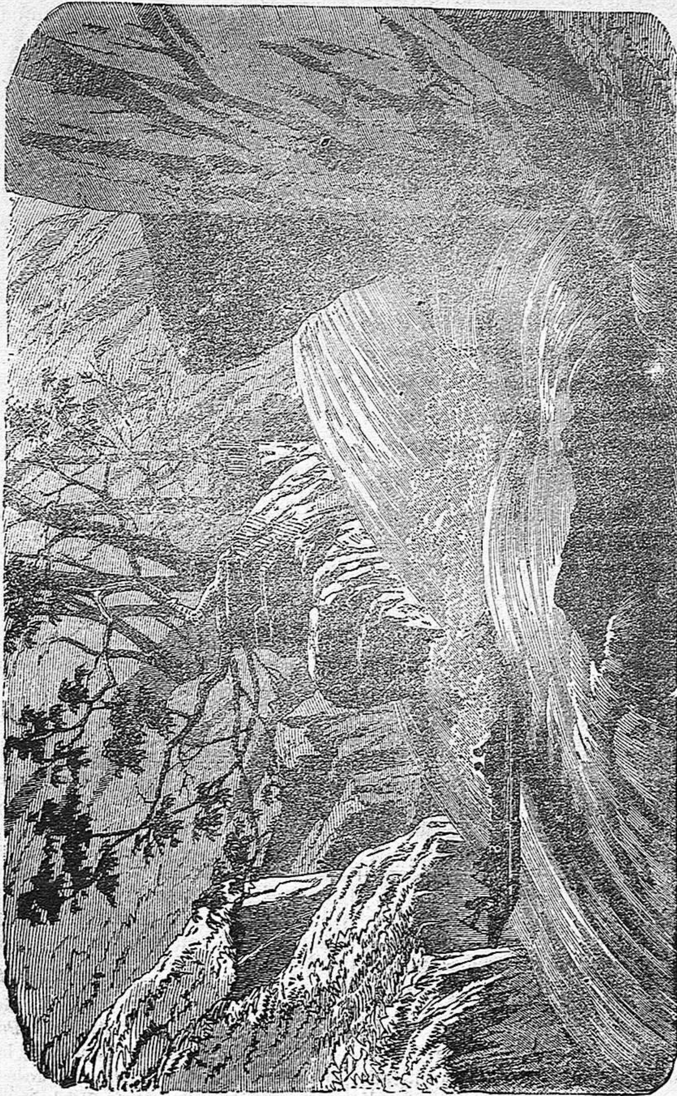
UNA CATARATA EN LA ISLA DE BORNEO.