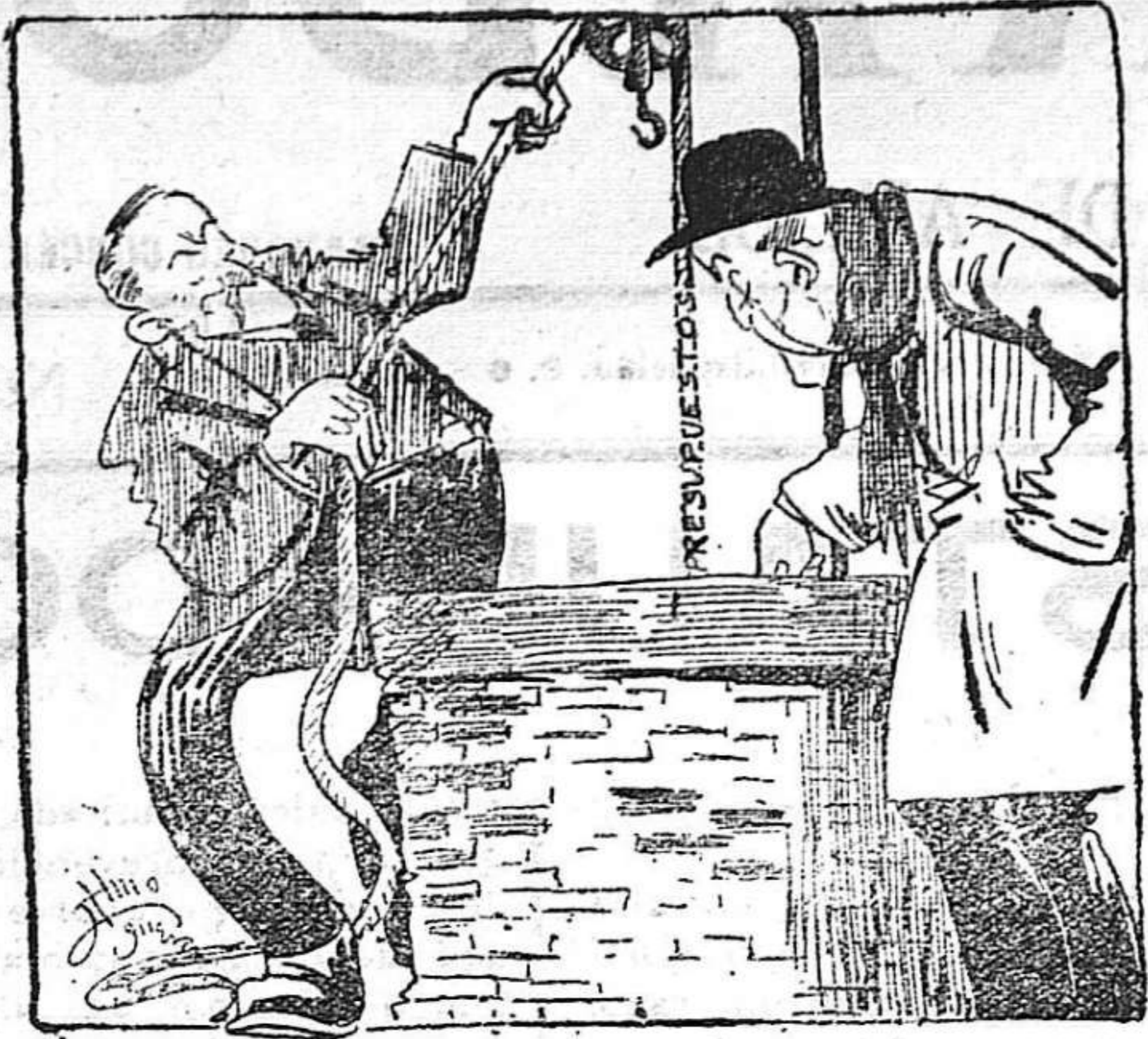
Moret.—Tira, tira, yo cogeré el caldero. El Conde.—¡Cuardete el Menguel! Pozo y pozal son míos.

Un día, mal día pera la meua vida de camisa, va entrá l' ama y a estiserades me vá deströssá. Del bossí mes grós ne vá fé bolquims.