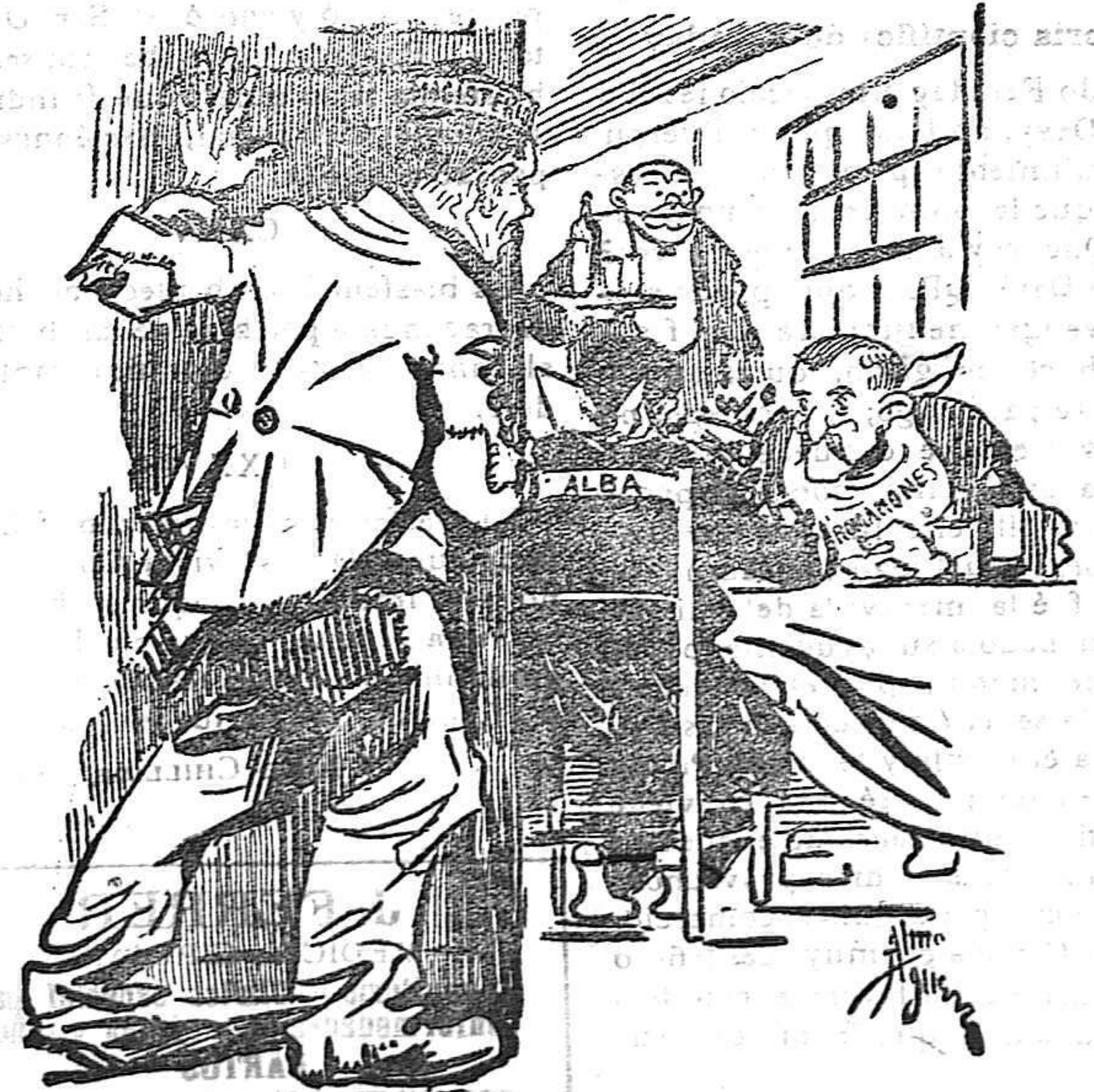
EL MAESTRO — ¡Y cómo devoran! Nada, como siempre, no dejarán para mí ni los huesos.