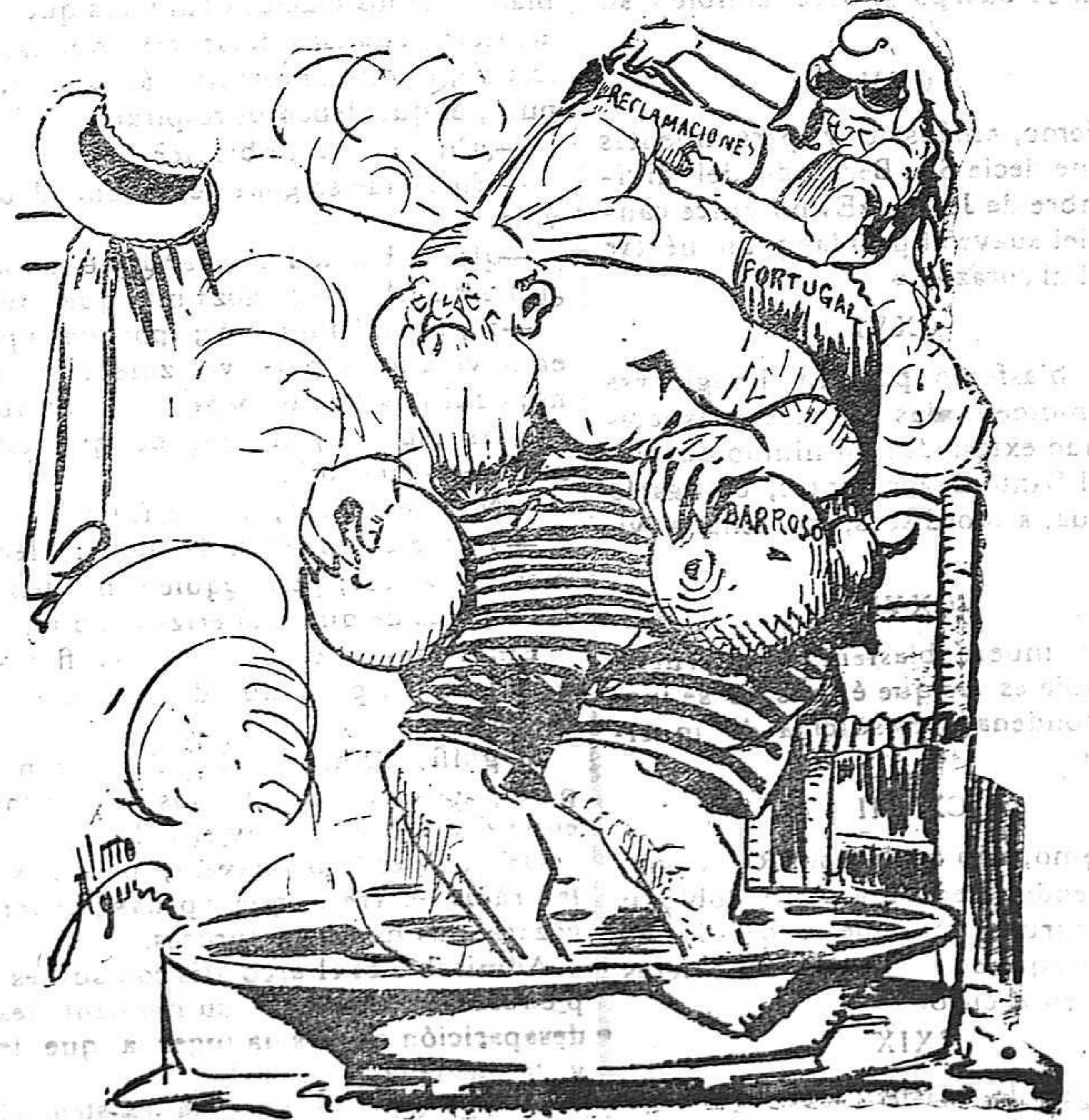
PORTUGAL.—Agua vá y fresca. BARROSO.—¡Ay! ¡ay! Que me achicharras.