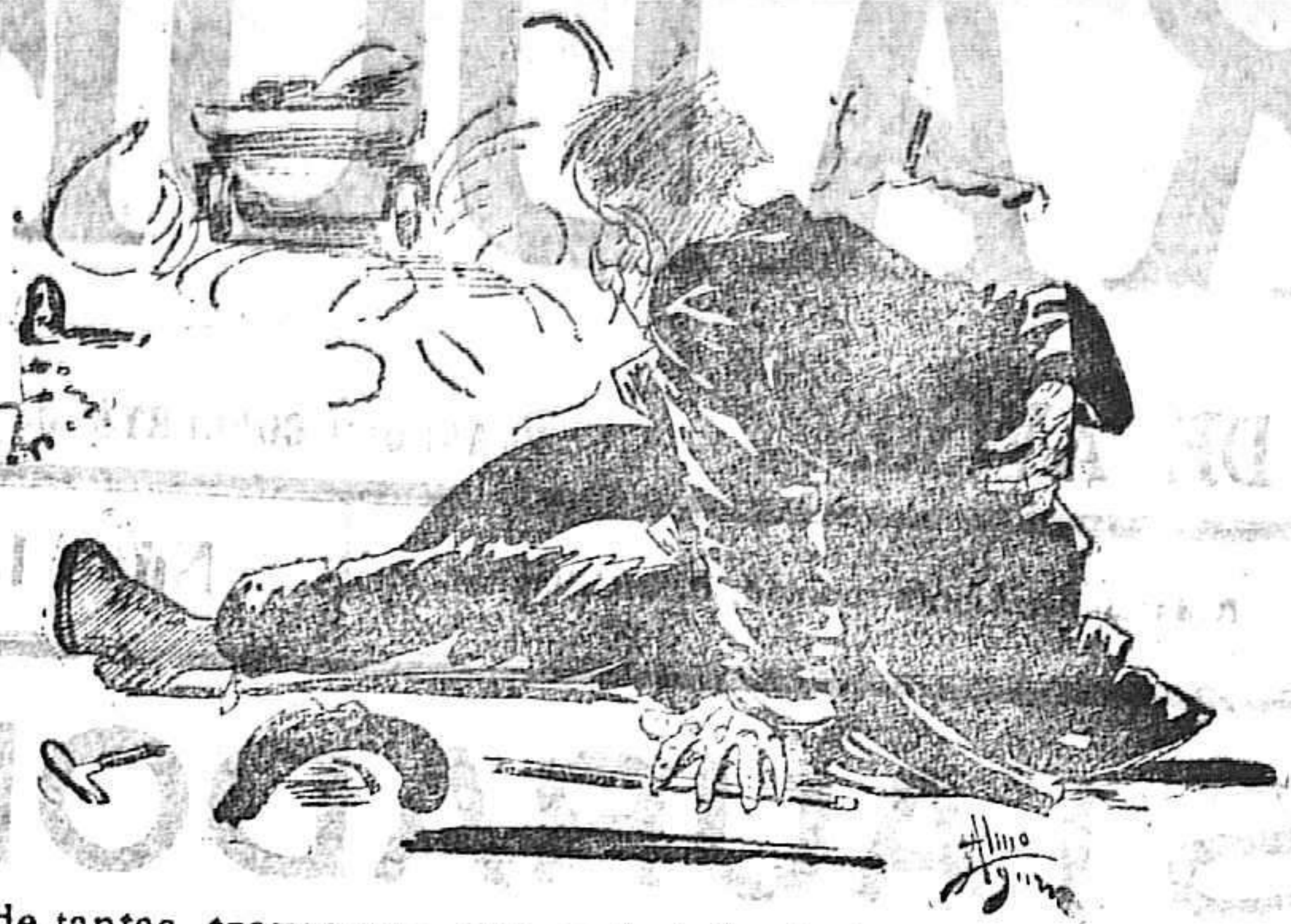
Después de tantas travesuras, este será el fin de los maquiavelismos del cojo

santa del Evangelio, y todos ellos están dispuestos a derramar su última gota de sangre en beneficio de su salvación. Ese es el fin novilismo de esos santos varones que se llaman misioneros. Eso es también lo que hizo aquel joven abnegadísimo, de ilusiones y santas esperanzas, a quien antes me refería.