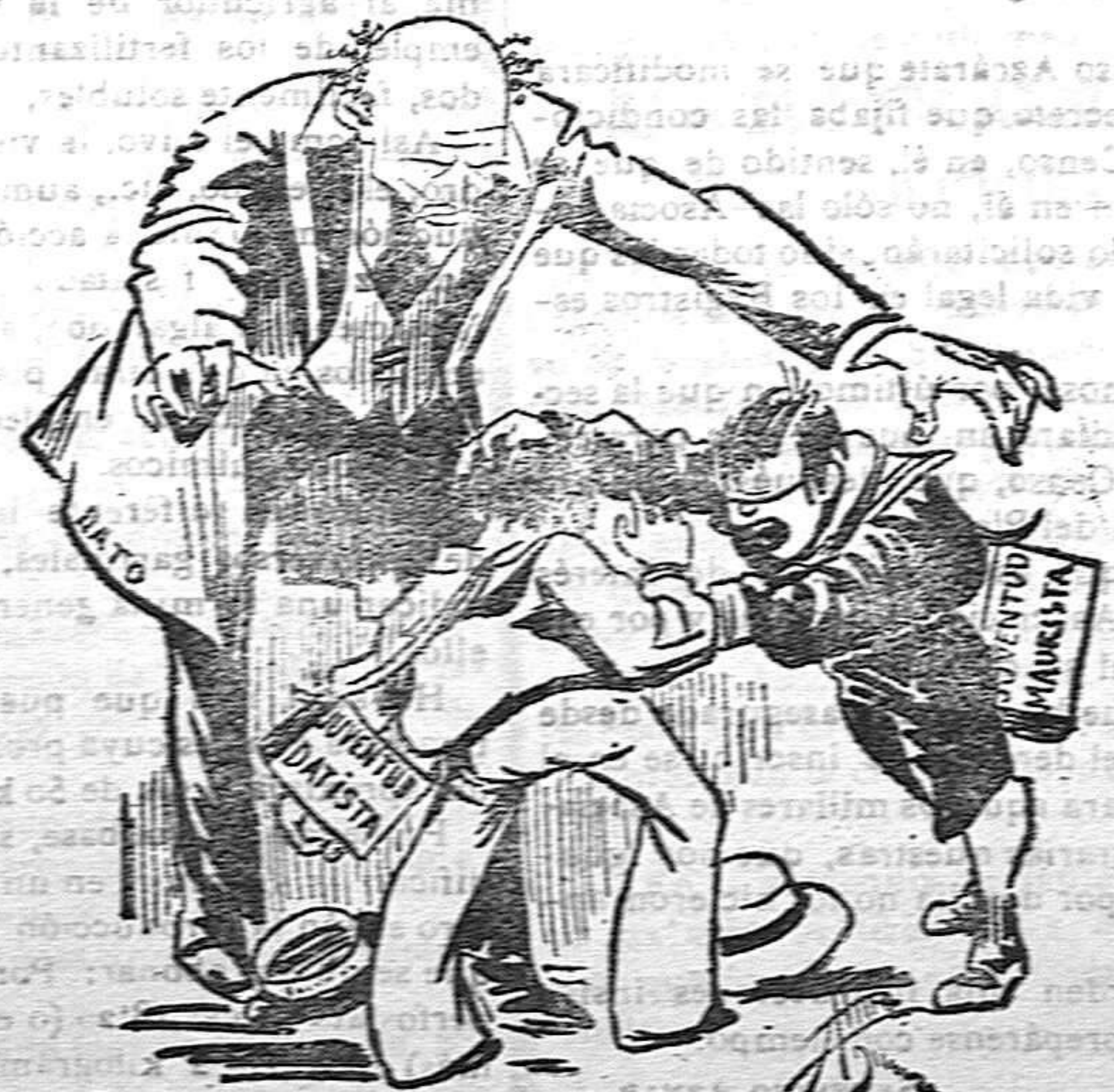
Dato.—Calma, calma pequeños, que estáis desacreditando a vuestros progenitores.