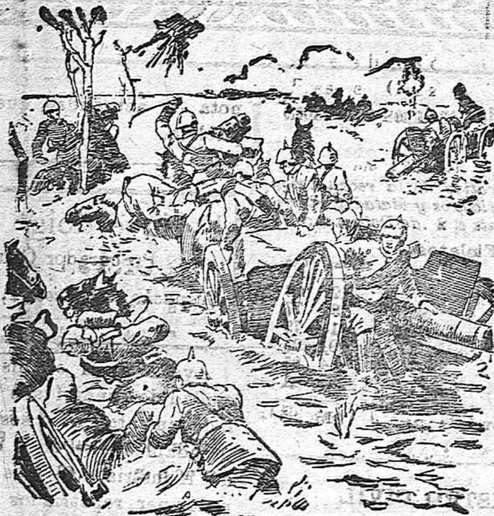
CUADROS DE LA GURRA.—Una batería alemana huyendo de la inundación provocada por los aliados en la región del canal de Iprés.

—Desde Calatorao (Prusia oriental) han llegado a Londres varios fugitivos ingleses que refieren horrores de las penalidades que han sufrido. Los alemanes el primer día de su cautiverio les hicieron tragar releses de pertaderas y hornillos eléctricos. Al cabo de una semana les arrojaron dentro de una cazuela de aceite hirviendo, aunque era aceite de primera. Un temporal de nieve enfrió el aceite: