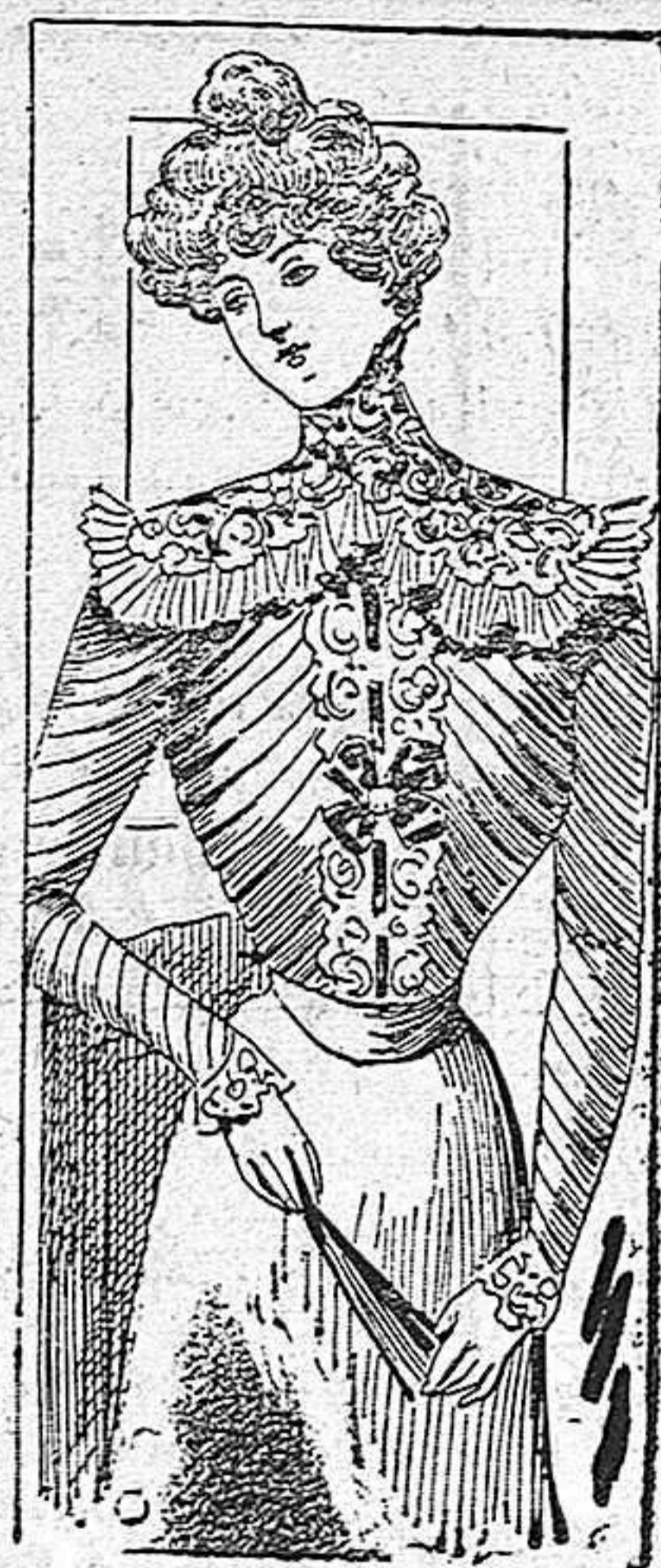
Vestit de camp pera senyoreta

Modelos exclussius pera nostras lectoras, dels grans magatzems de EL SIGLO, de Barcelona.