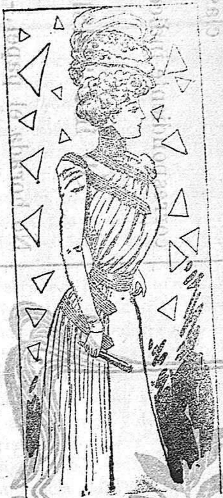
Traje para campo

Se compone de un vestido de pita pongis, cortado en forma de túnica. Lleva este vestido un drapeado que cruza el delantero del cuerpo y continúa hasta el bajo de la falda por uno de sus lados. Guarnecen el cuerpo dos patas de cordones sujetas en mitad del delantero. Cuello y cinturón también de cordones. Mangas rectas y en el bajo de la túnica dos tiras de cordones.