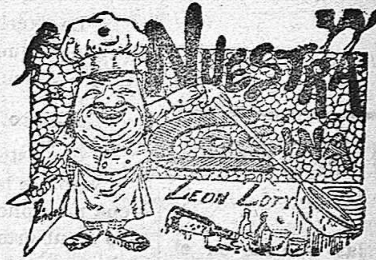
COMIDAS PARA EL 26 DE MAYO POR LEON LOTY

Firmadas capitulaciones, muchas mas beneficiosas para los árabes que ellos pudieron suponer, el 25 de Mayo de 1085 hizo Alfonso V su entrada en Toledo, rodeado de su hueste de nobles caballeros y seguido de su ejército.