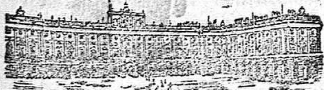
Plaza de Armas

Tiene este palacio la entrada principal por la parte Sur, la cual da acceso á un gran patio cuadrado de 240 pies de lado, con una galería de cristales en su parte superior. En este patio se halla la escalera principal por donde se sube á las habitaciones reales.