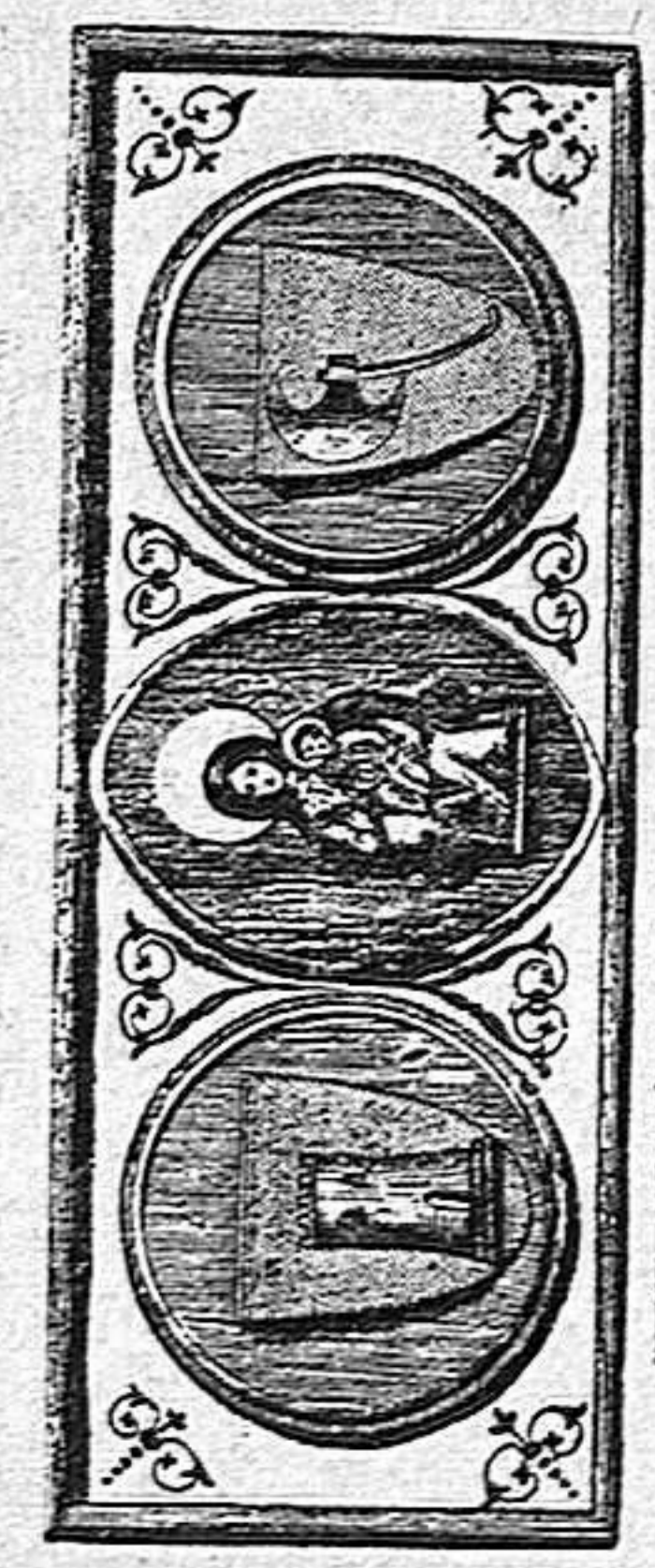
LAPIDA DEL CLAUSTR ab los antics segells del Municipi, Capítol y Ordre de la Destral.