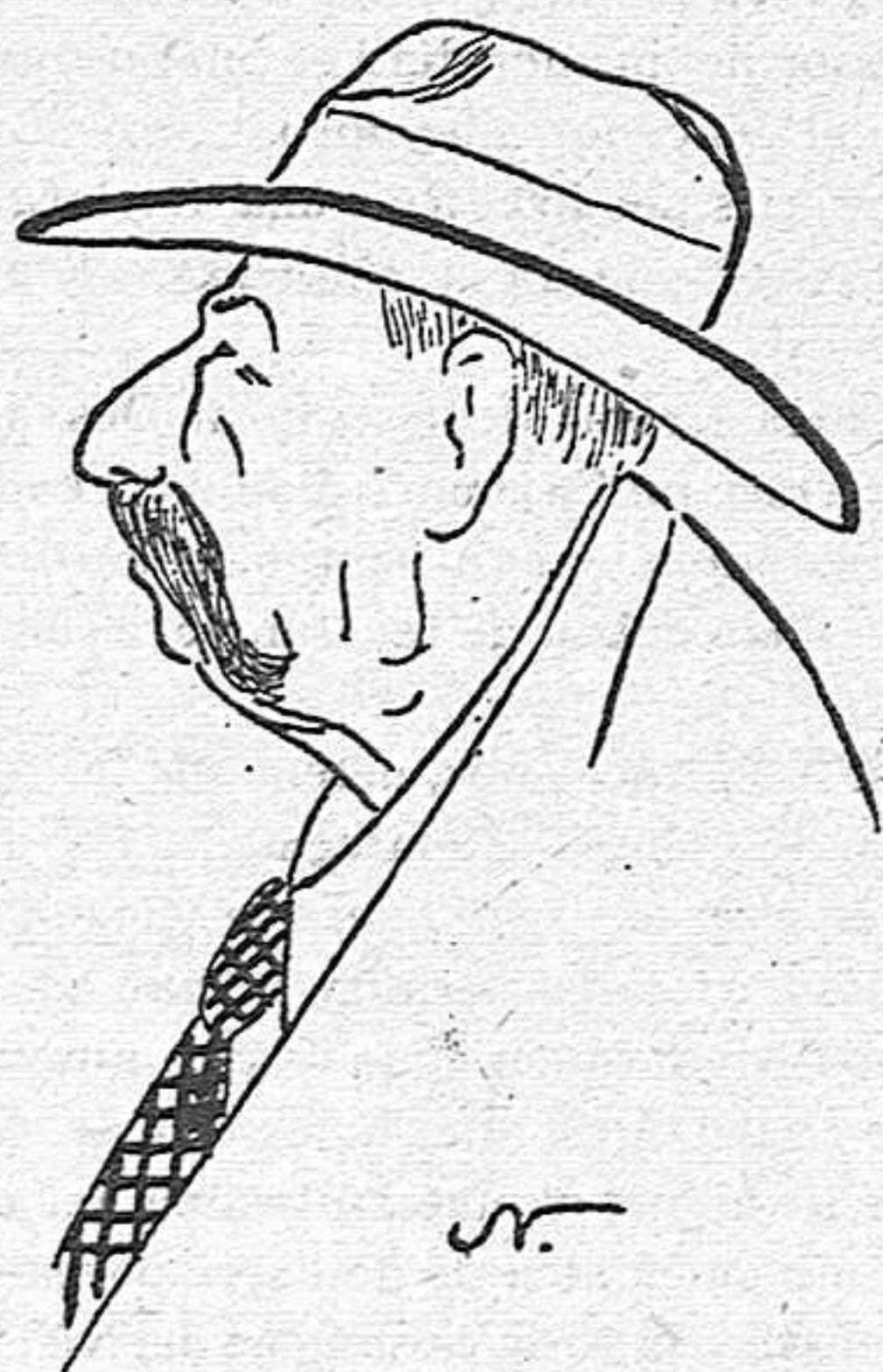
En Balmas, fabricant de paperines

UNA altre parella va a passeig i ella rellisca i cau: Ell:—Com hi ha mon!: sempre badarém! (Fa dos anys que son casats).