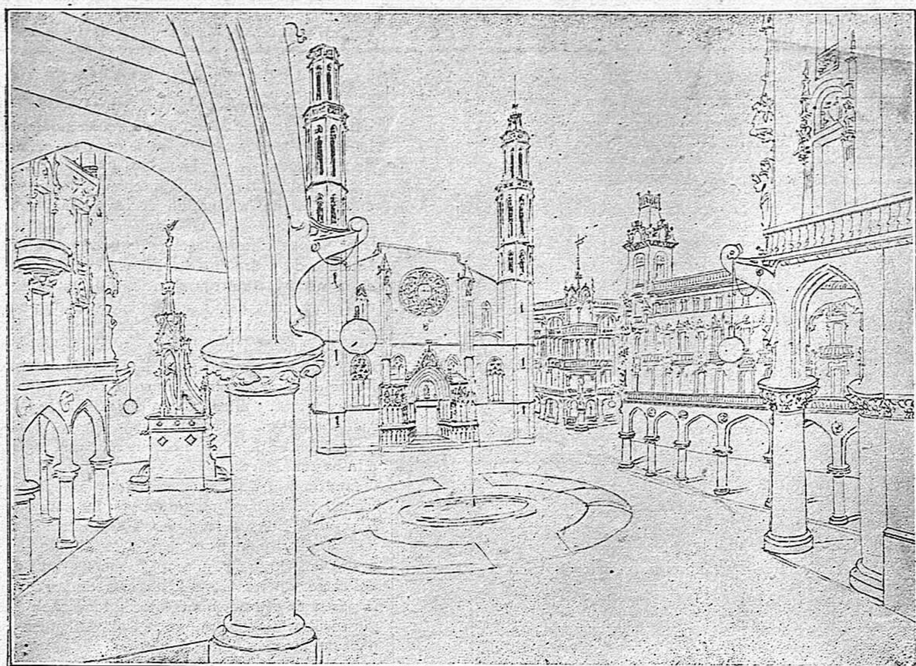
Plaça de Sta. Maria, vista des del carrer que sortint de la Via Laietana es dirigeix a la porta principal de l'Iglésia de Sta. Maria del Mar.

Projecte de l'arquitecte En Lluís Domènech i Montaner