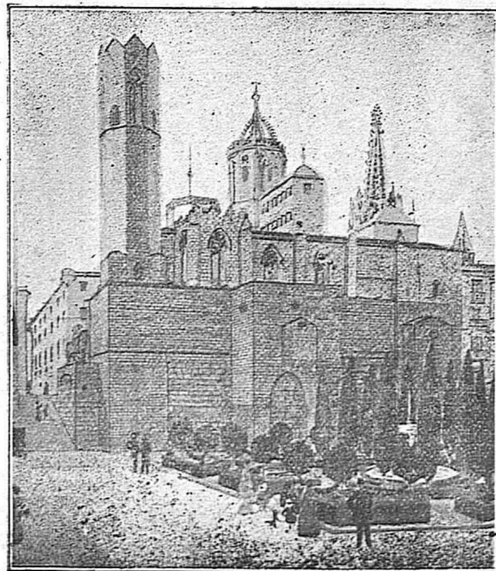
Iglésia de Sta. Agueda, vista des de la Via Laietana. A l'esquerra, el pas que condueix a la plaça del Rei. Al fons el cimbori i els campanars de la Catedral.

Imp. J. TRAYTER, Cervantes, 13, Figueres.