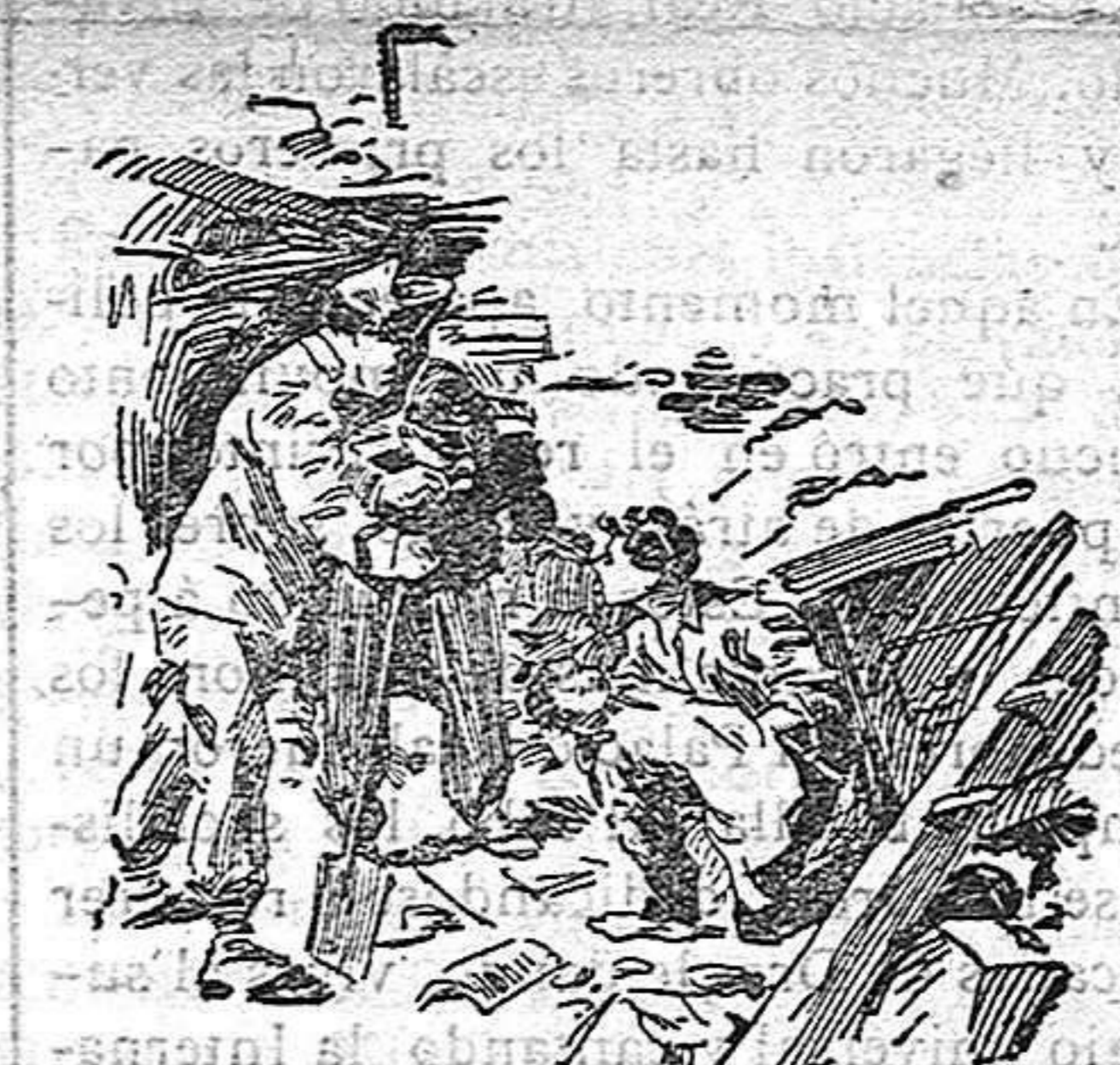
Un episodio de los trabajos de salvamento.