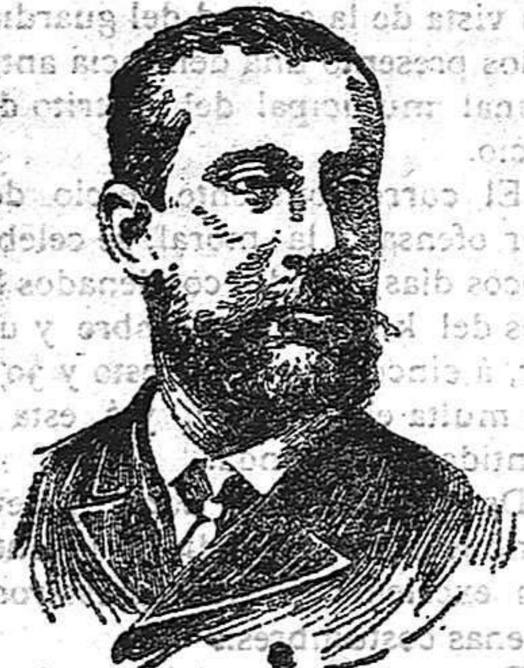
EL PRÍNCIPE ALBERTO DE MÓNACO

A las actuales regatas es probable siga el concurso de aviadores. Parece ser que éstos no se muestran muy dispuestos á recoger la invitación del príncipe de Mónaco, y si de aquí á la fecha fijada no fuera posible vencer las dificultades