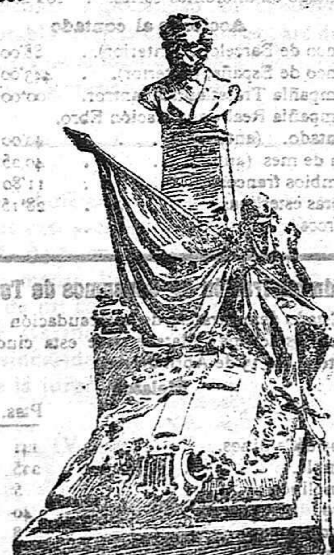
EL MAUSOLEO DEL MAESTRO CHUECA

Como pueden observar nuestros lectores por el anterior grabado, el monumento no carecerá de originalidad y belleza. Sentado sobre el basamento en que descansa el pedestal que sostiene el busto del popular compositor madrileño, sin chispero, con el cuerpo inclinado hacia adelante como abrumado por hondo dolor, simboliza al pueblo del oso y del madroño llorando la pérdida del autor de tantas notables composiciones.