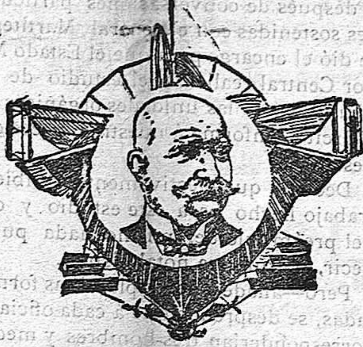
EL CONDE ZEPPELIN Y SU DIRIGIBLE

para desde él darle la bienvenida. A la hora convenida abandonó el aerostato su caseta flotante del lago Constanza, y efectuando varias evoluciones marchó al encuentro del tren imperial, el que siguió buen trecho hasta su llegada á la