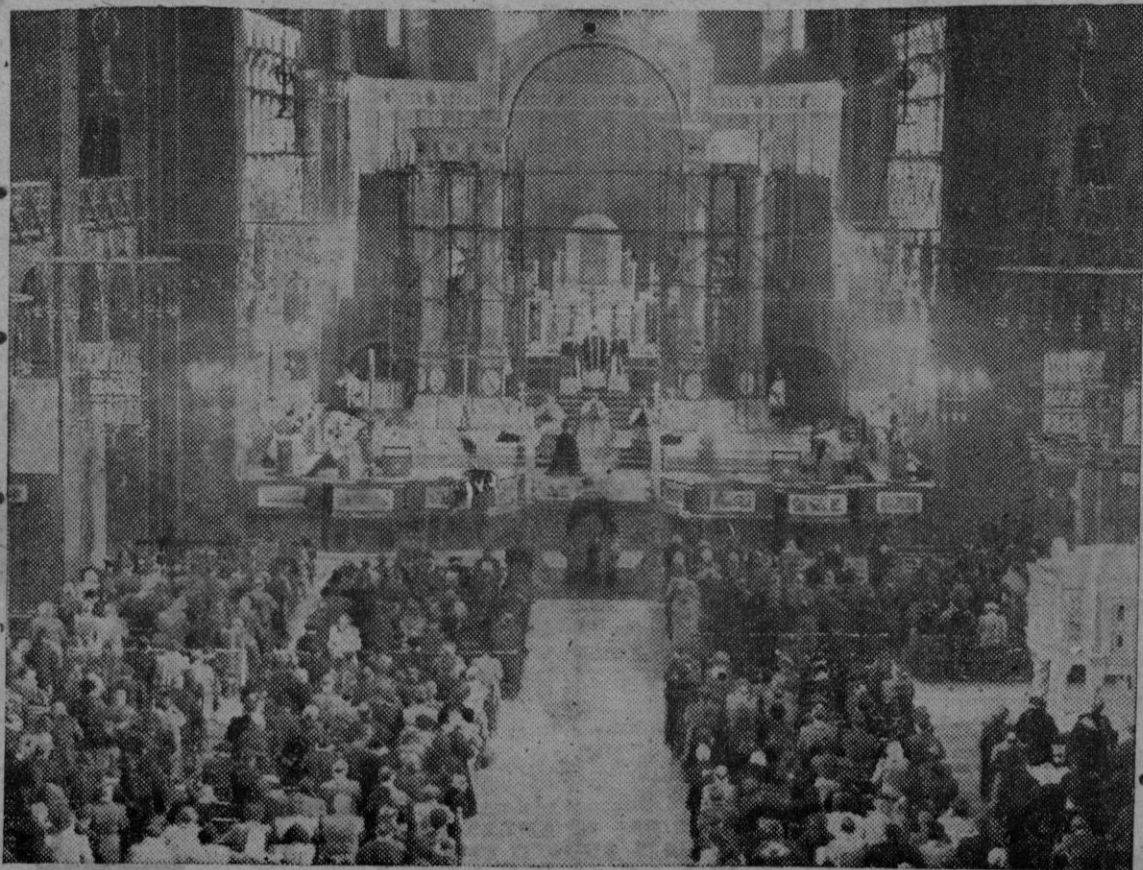
Servicio religioso llevado a cabo en la Catedral de Westminster de Londres, por las almas de las personas muertas en los campos de concentración alemanes

Five (Escocia). — El yate Hitler "Grille" ha llegado con la tripulación alemana a este puerto.