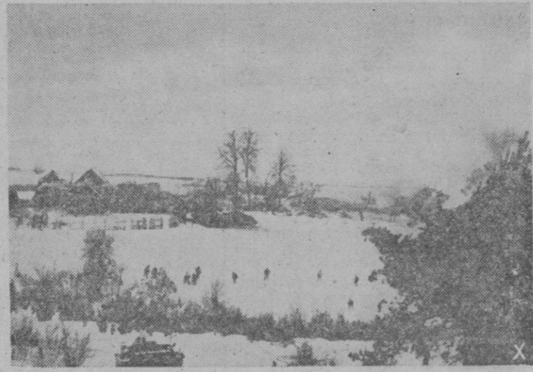
Sobre las nieves de Rusia, avanzan los alemanes en un contraataque

Berlin (Urgente). — Las fuerzas alemanas han roto el frente soviético al oeste y noroeste de Jarkov, y continúan su avance, anunciándose en la capital del Reich.