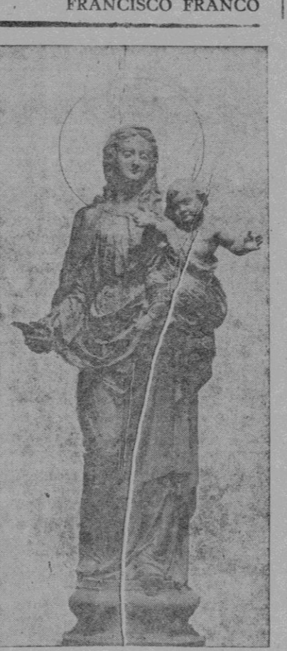
Virgen de la Presentación, Titular de la Catedral de Ciudadela (Menorca), tallada en madera, de dos metros cincuenta de altura, para colocar en el presbiterio de la catedral menorquina, que se está actualmente restaurando bajo la dirección del arquitecto señor Rubió. Es obra del escultor T. Vila

Artículo quinto. — Son aplicables a los estudiantes que aspiren a ingresar en la oficialidad de complemento lo que preceptúan las leyes de 2 de julio y 8 de agosto de 1940 y no se oponga a la presente disposición. Así lo dispongo por el presente decreto dado en Madrid a 22 de febrero de 1941. FRANCISCO FRANCO