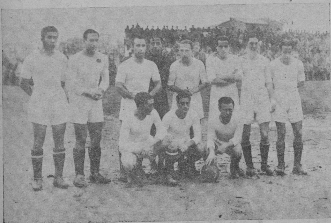
El equipo del Oviedo que luchó anteayer con el Mallorca, venciendo por 3 a 1

Para que los niños puedan dedicar a su recreo las horas de asueto, han sido señalados, interinamente, los sitios siguientes: Murallas; Puerta del Campo; solar lindante con la manzana adosada a Factorías Militares, Jardines del Mercado; solar de la an-