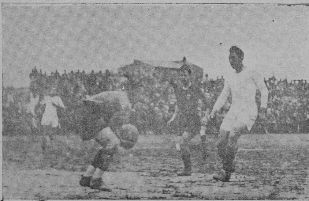
Estabens, bloca un balón evitando el remate de Lángara