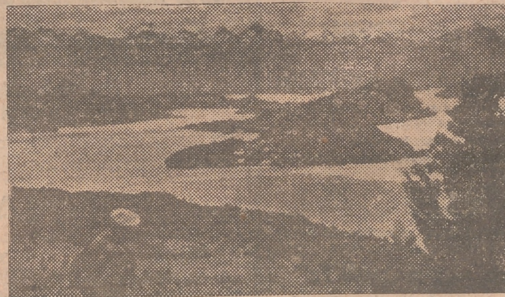
Una vista de la isla Huemul, en el lago Nahuel Huapi, cerca de San Carlos de Bariloche y a unos mil kilómetros al sur de Buenos Aires, donde el Gobierno argentino ha establecido sus centros de investigación atómica